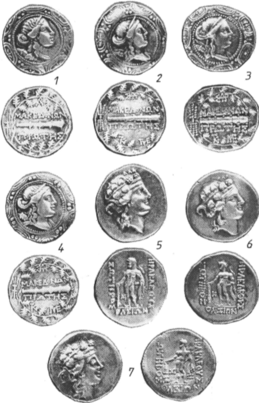
Un tezaur descoperit la Silistra.