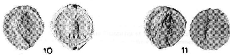
Denari romani imperiali din tezaurul găsit la Desa, județul Dolj