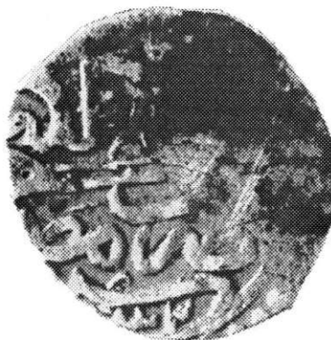
Un tezaur otoman din secolul al XVII-lea descoperit la Nalbant, județul Tulcea