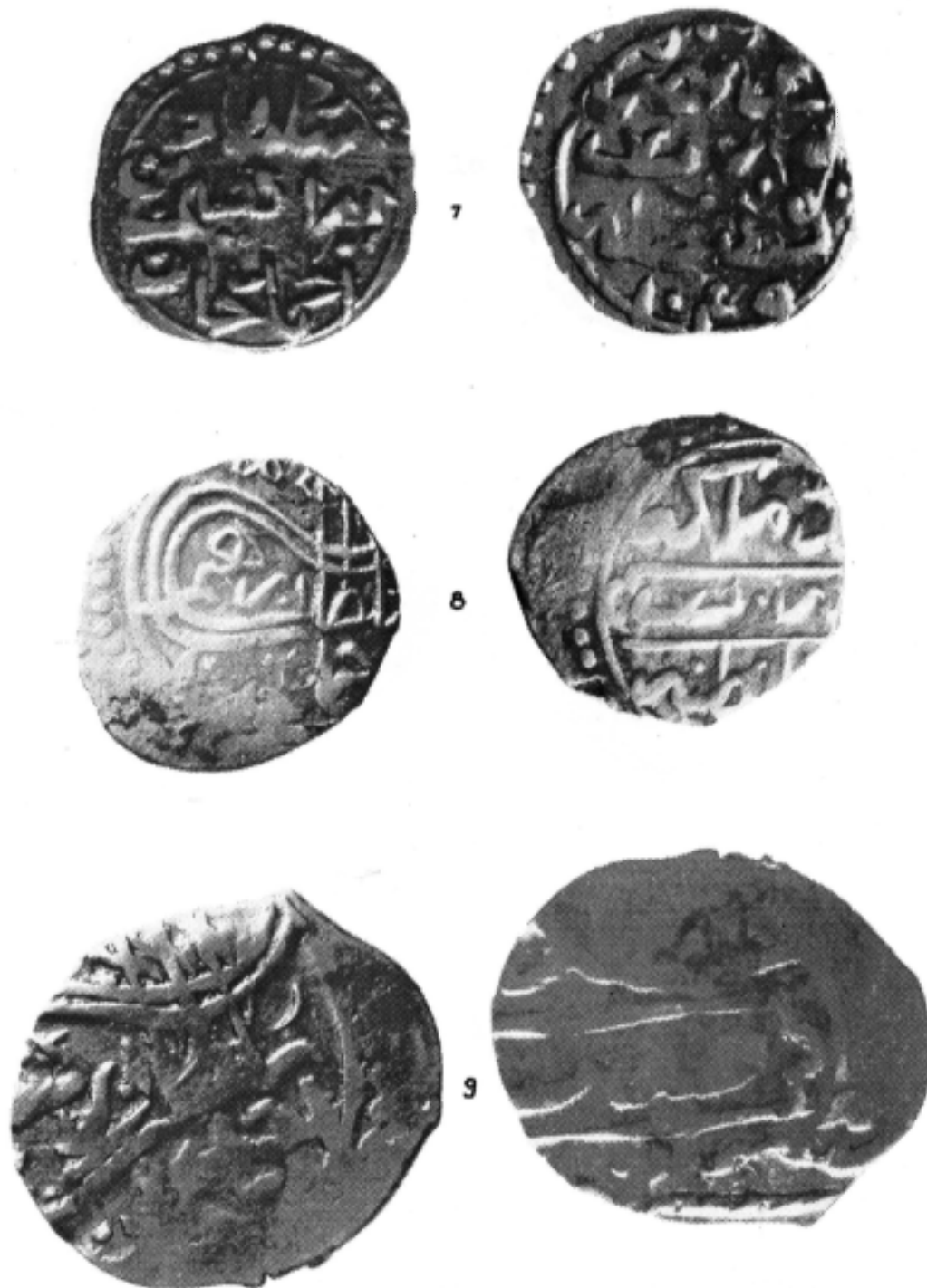
Un tezaur otoman din secolul al XVII-lea descoperit la Nalbant, județul Tulcea