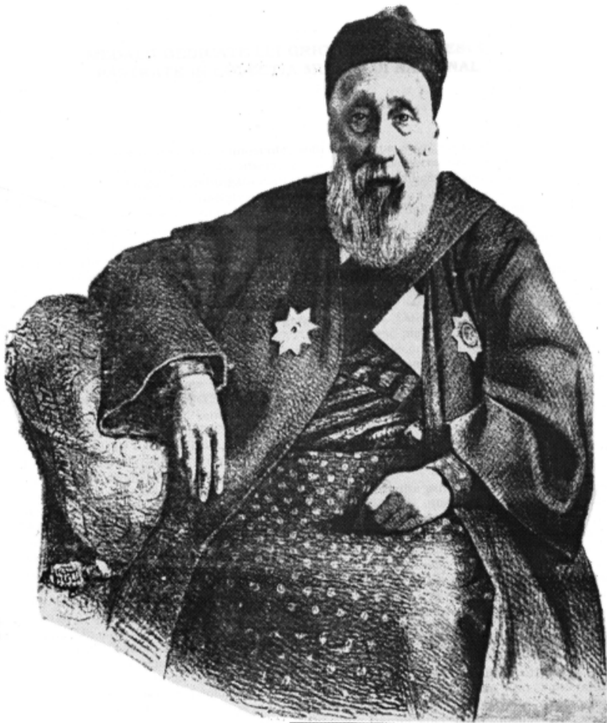
ALEXANDRU HANGERLI, 1807 DOMN AL ȚĂRII-ROMÂNEȘTI după un portret găsit de d. C. Karadja la Stockholm

Contribuții la cunoașterea unor medalii de secolele XVIII-XIX