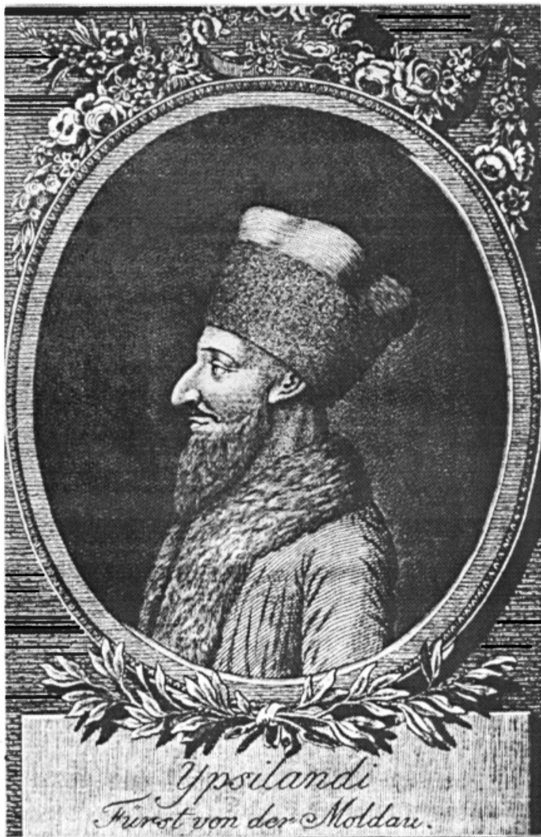
CONSTANTIN IPSILANTI, 1802–1806 DOMN AL MOLDOVEI după o stampă contemporană (sec. al XIX-lea)

Contribuții la cunoașterea unor medalii de secolele XVIII–XIX