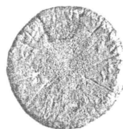
Planșa III: Depozitul monetar nr. 2 descoperit în Tomis