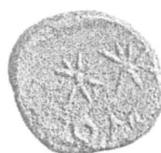
Planșa II: Descoperiri monetare tomitane: izolate (11-15) și depozitul nr. 1 (26-29)