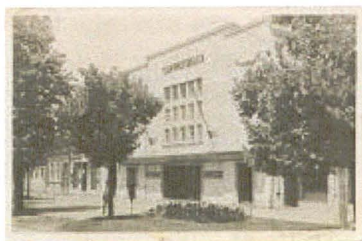
Reșița - Casa Muncitorească