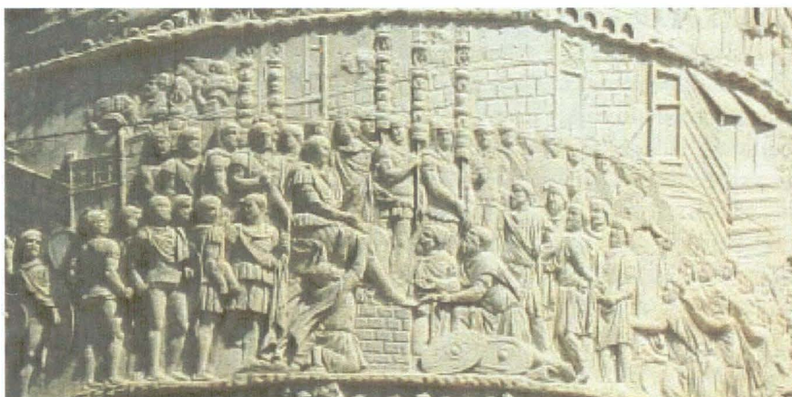
Secvență de pe Columna lui Traian

Probabil că Domițian a hotărât să îngenuncheze Dacia, dar el dorea mai întâi să-i pedepsească pe cvazi și pe marcomani, amândouă populații de neam germanic, care refuză să acorde ajutor Romei în războiul cu Decebal și care amenințau dinspre Pannonia, flancul și spatele armatei imperiale. Plecat în Pannonia, Domițian refuză să-i asculte pe solii cvazi și marcomani, și trece apoi la ofensivă. Dar Domițian este înfrânt pe frontul Panoniei. 1