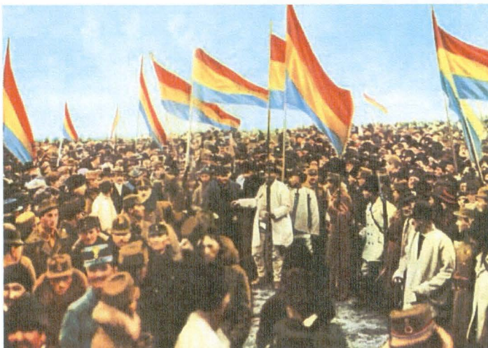
Alba Iulia - 1 Decembrie 1918