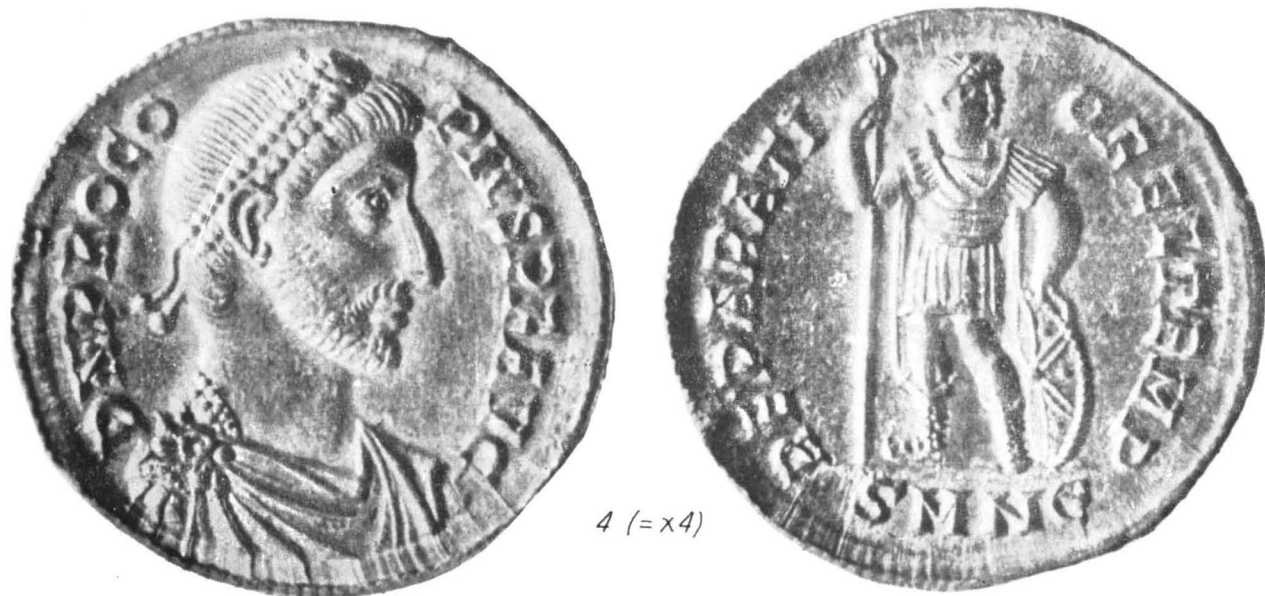
Fig. 1. Monnaies découvertes en Roumanie.