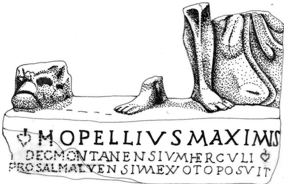
Fig. 3. L'inscription de Cioroiul Nou (photo et dessin).

Les fouilles archéologiques effectuées par D. Tudor entre 1957-1966 et en 1977 ont complété les données concernant le plan de la zone civile de Sucidava: de forme trapézoïdale, entourée par un mur