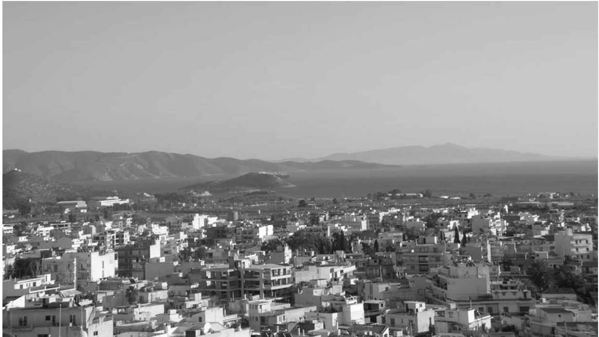
a. Vue de Pachi (en arrière plan) de Mégare, avec la colline de Saint-Georges à gauche et le Paliokastro à droite.