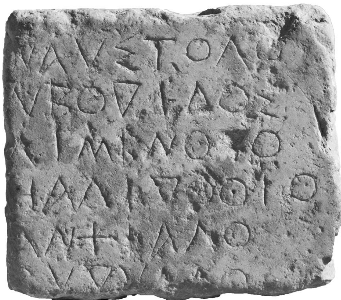
Pl. IV – Mégare. Liste de héros.