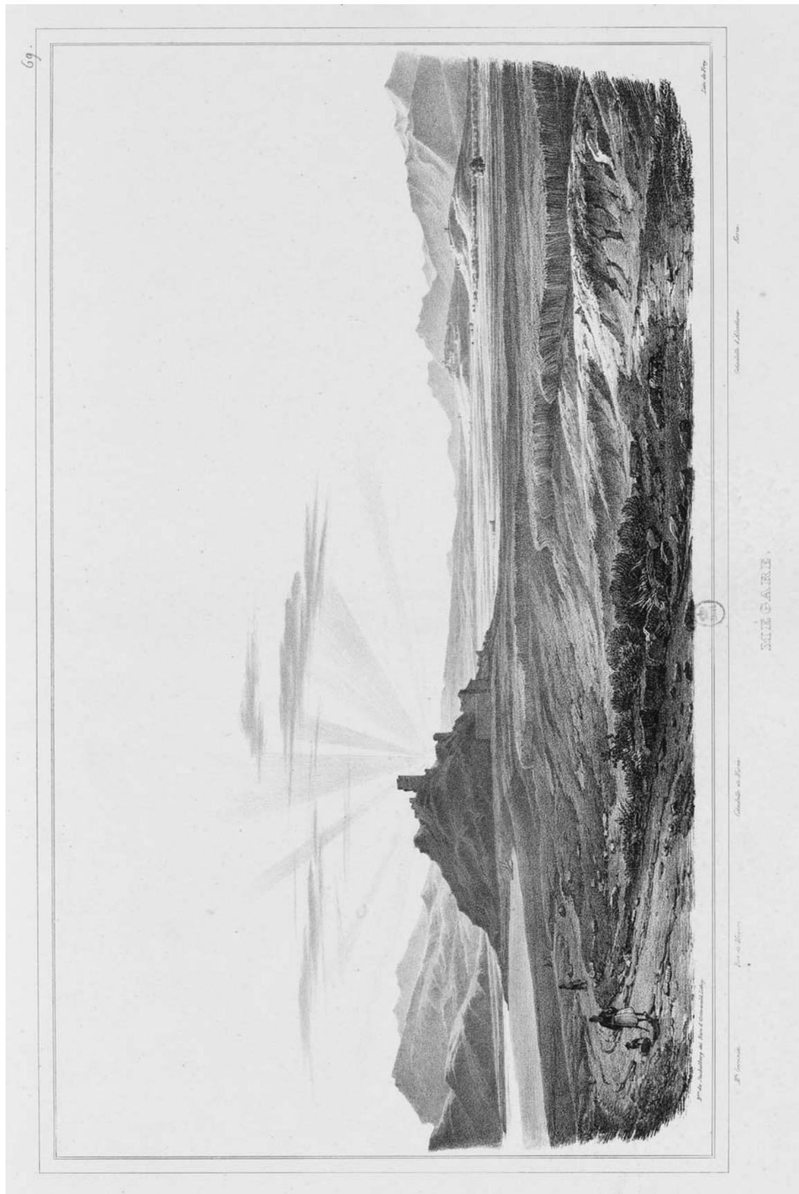
Pl. II – Vue de Mégare et de la forteresse de Paliokastro.