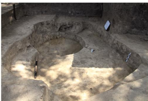
Negrileşti, jud. Galați, suprafața SSP/2021. Komplexe din secolele IX-X. 1. Cx.3, vatră cuptor; 2-4. Cx.7, locuință perforată de o groapă modernă.