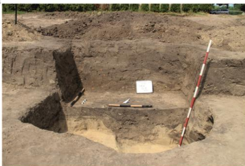
Negrileşti, jud. Galați, suprafața SSP/2021. 1. Imagine generală a suprafeței SSP; 2-3. Cx.10, locuință de secol X; 4- Cx.12, locuință modernă