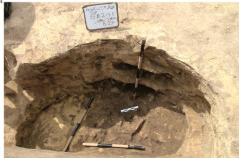
Negriștești, jud. Galați, suprafața SSP/2021. 1-2. Cx.36 complex de locuire din epoca bronzului; 3. Cx.11, cuptor casnic, secolul al IV-lea; 4. Cx.27, groapă menajeră, secolul al IV-lea.