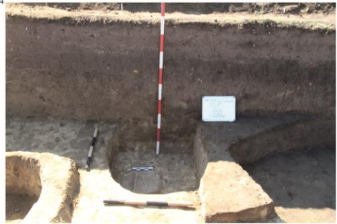
Negriștești, jud. Galați, suprafața SSP/2021. Komplexe din epoca bronzului (cultura Noua). Gropi menajere. 1. Cx.8 și Cx.9; 2. Cx.13; 3. Cx.20 și Cx.21. 4. Cx.21.