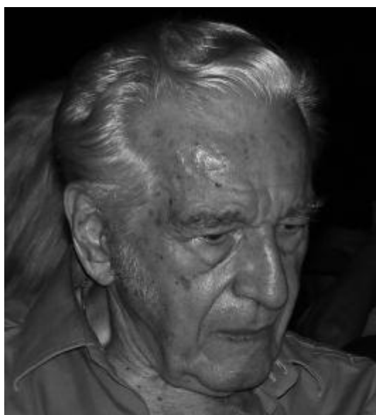
Sergiu Nicolaescu la Galați

Eveniment: luna festivalurilor ( albume foto realizate de către Nicolaie Sburan, Florin Matei și a.g.secară ); palmaresuri: p.2-3, 48);