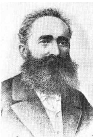
B. P. Hasdeu în anul 1884

Beneficiind de o cultură vastă și cunoașterea a nenumărate limbi străine, toate cercetările lui sunt extinse în foarte multe domenii. Un bun exemplu îl constituie lucrarea, poate cea mai reprezentativă pentru acest geniu enciclopedic, Etymologicum Magnum Romaniae , care era proiectată a fi doar un dicționar academic al limbii române.