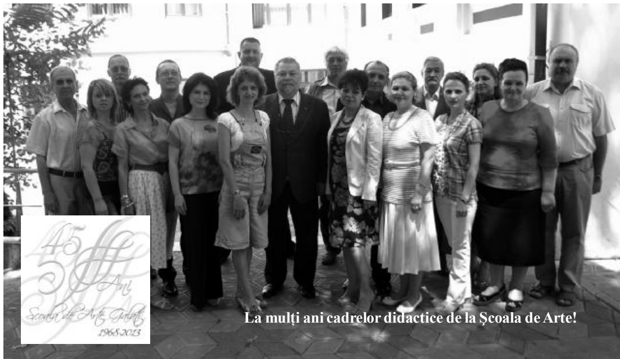
La mulți ani cadrelor didactice de la Școala de Arte!

Școala de Arte se pregătește de sărbătoare! Împlinește 45 de ani!