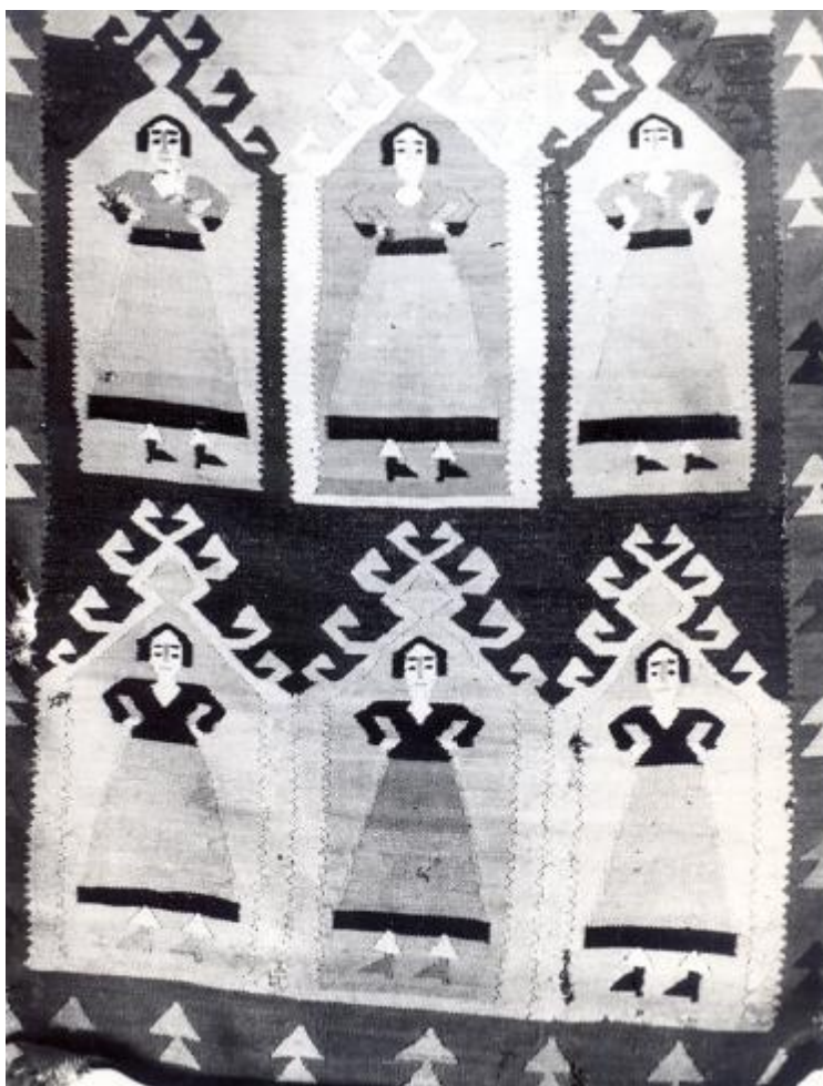
Colecția Tomaselli și E. Holban. Covor cu motive antropomorfe înscrise în nișe (fragment). Urzeala și bătaia - lână: 170/107. Pigmenți naturali. Starea de conservare: uzat. A doua jumătate a secolului al XIX-lea.

Din momentul în care se apuca de treabă, nu se mai ridica, până ce nu termina de secerat un snop de grâu. „Primul snop”, act ritual foarte important. Îl lega și de abia apoi se ridica, cu snop cu tot. În acel moment membrii familiei, care păstrasera în continuare aceeași atmosferă solemnă, izbucneau într-un chiot puternic de bucurie.