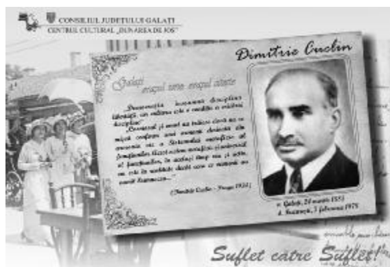
Cartea poștală dedicată lui Dimitrie Cuclin