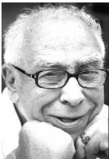
Art Buchwald (SUA)