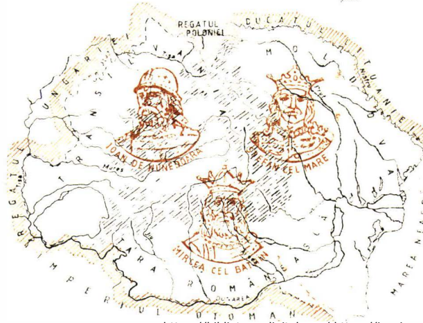
Țara Românească, Transilvania și Moldova în vremea domniilor lui Mircea cel Bătrân, Ioan de Hunedoara și Ștefan cel Mare, sec. XIV-XV (după Atlas istoric, București, 1971).