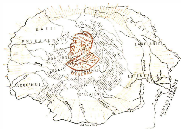
Dacia în timpul lui Decebal, sec. I e.n. (după Constantin C. Giurescu, Dinu C. Giurescu, Istoria românilor, București, 1975).