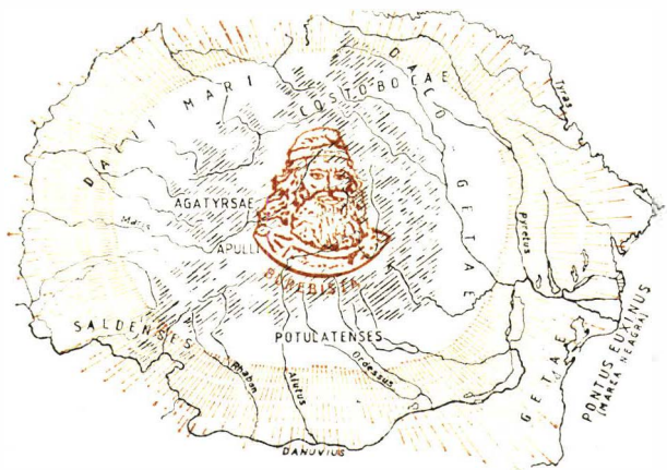
Statul dac centralizat și independent în vremea lui Burebista, sec. I î.e.n. (după Atlas istoric, București, 1971).