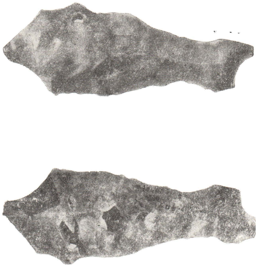
FIG. 3 Mitoc—Valea Izvorului, piesă de silix (figură de pește ?).

2 — Componenta tipologică și caracterele tehnicii de cioplire indică un facies cultural specific zonei Prutului mijlociu cu piese denticulate bifaciale și cu un procent foarte ridicat de lame. El reprezintă fie faza cea mai târzie de dezvoltare a musterianului din zonă, fie o nouă cultură care s-a dezvoltat pe baza acestuia la începutul paleoliticului superior, în