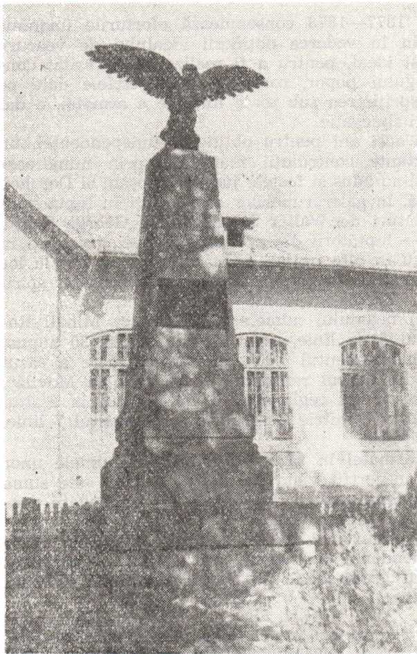
Flămânzi. Monumentul eroilor căzuți în războiul pentru independență din 1877—1878.