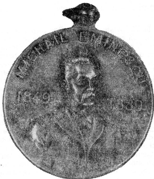
1 Medalion de argint „ Michail Eminescu 1849—1889“. (c. 1899), necunoscut autorilor catalogului „ Medalii și plachete românești “.

deschis „drumul în Plaiul Ialomiții, spre Brașov“ 15 . Într-un alt serial, intitulat „ Revista statistică “, apărut în aceeași publicație ieșeană, nr. 90-93 din 15-22 august 1816, tânărul redactor prezintă și comentează sporul natural al populației județului nostru în intervalul 1870—1874 16 . Prețuirea datelor statistice rămâne constantă și în perioada bucureșteană a