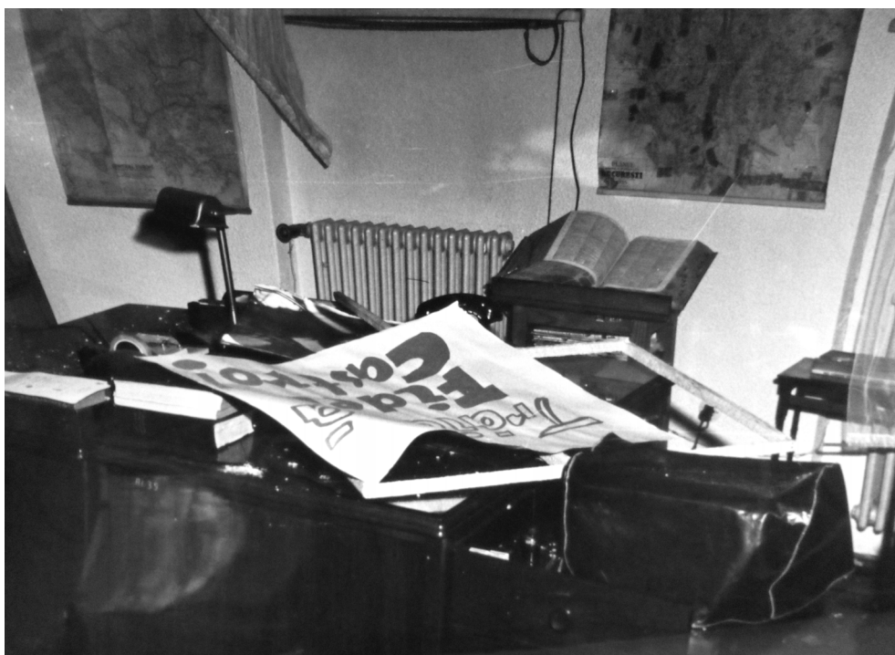
Figura 6. Cadru surprins în interiorul Legației, imediat după atac.