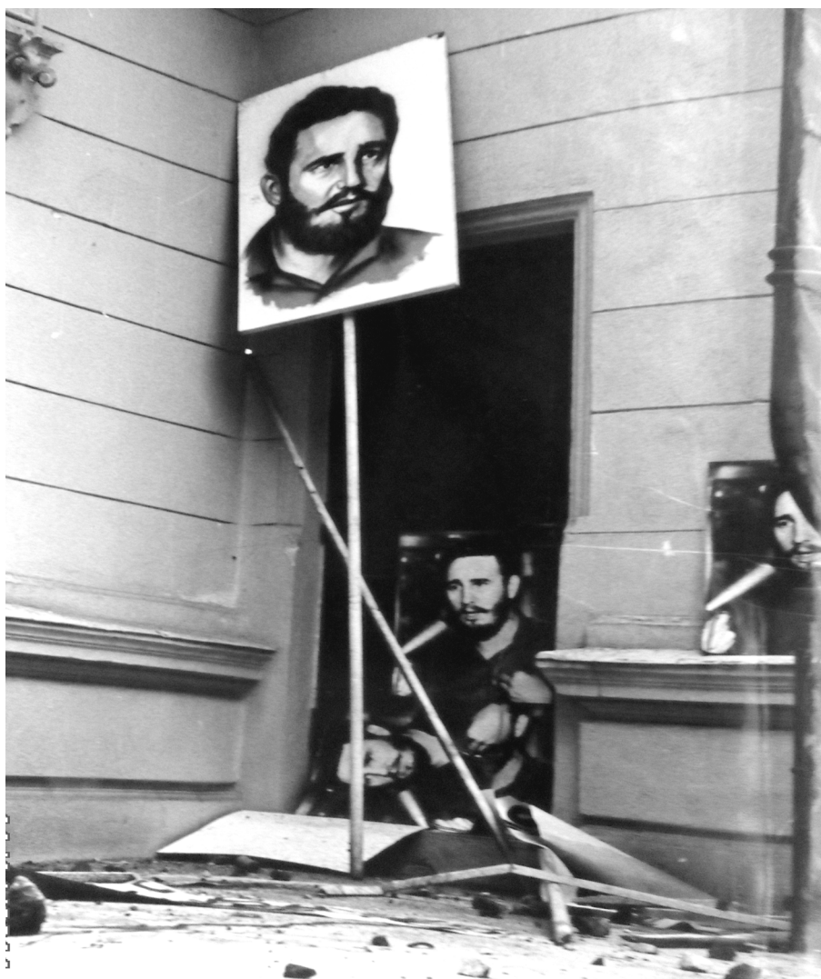
Figura 7. Daune produse la parterul imobilului, la una dintre intrările în Legație.