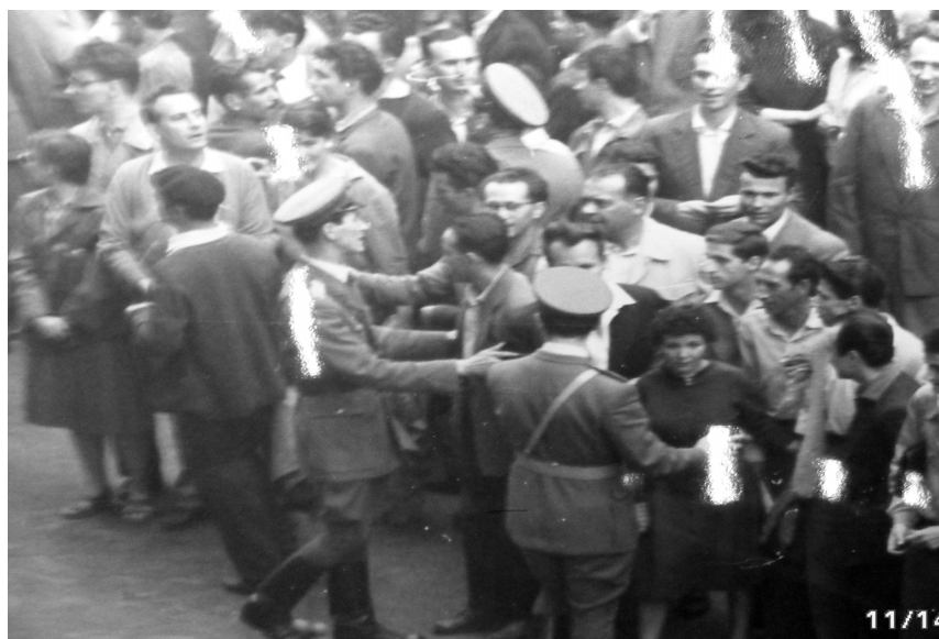
Figura 5. Dispersarea, într-un final, a ultimilor manifestanți, după intervenția forțelor de ordine.