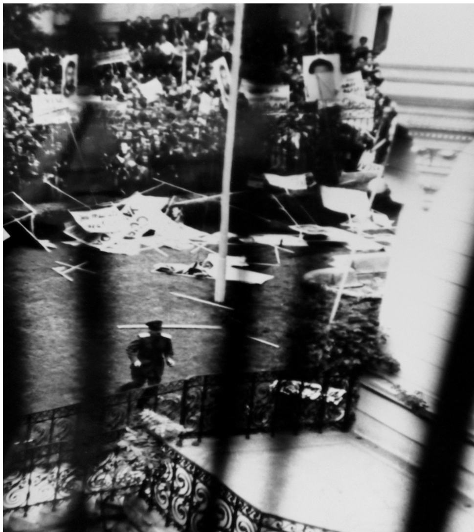
Figura 2. Un grup de manifestanți, însoțiți de milițieni, pătrund în curtea Legației.