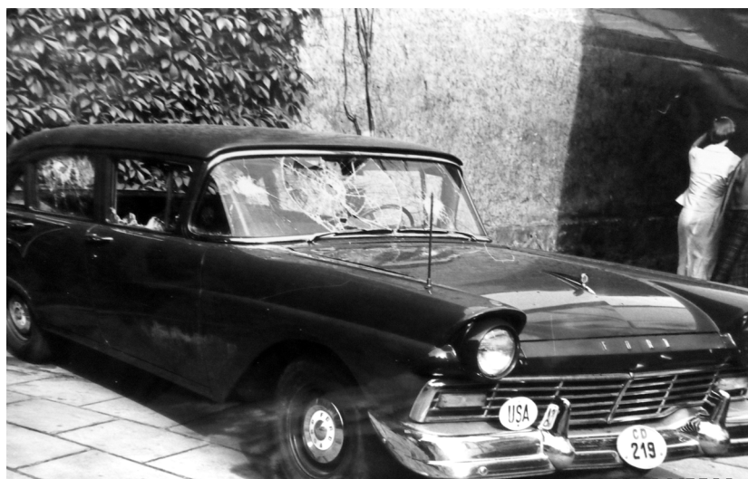
Figura 4. Alt automobil oficial al Legației SUA la București cu urme vizibile ale actelor de vandalism.