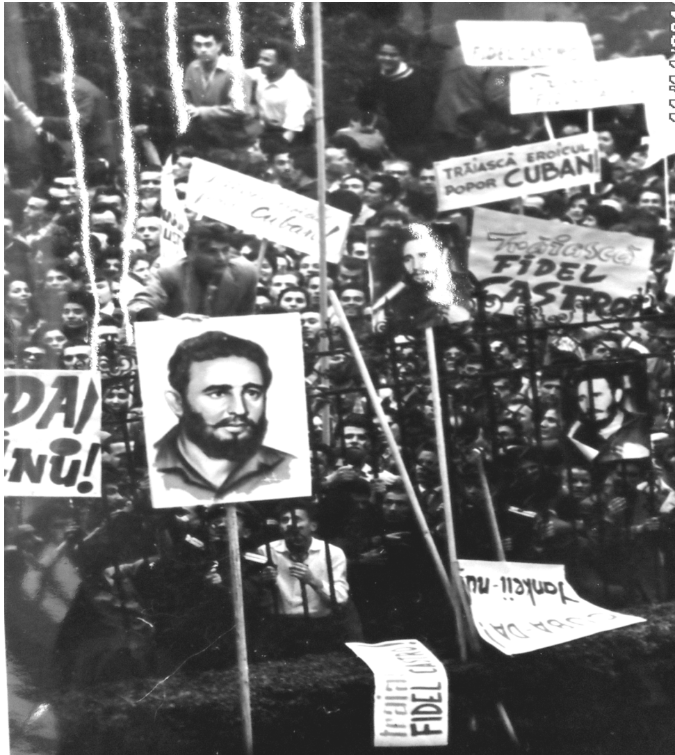
Figura 1. Începutul atacului împotriva Legației SUA (București, 19 aprilie 1961).