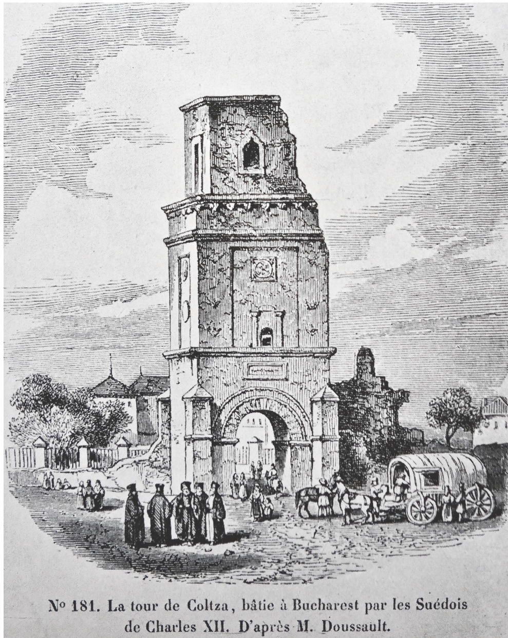
Figura 2. Turnul Colței – gravură în oțel după un desen de Charles Doussault (1818–1880).