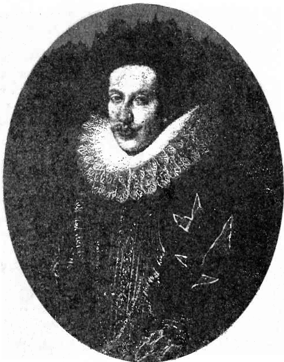
Fig.4. Cosimo II (Giusto Sustermans)