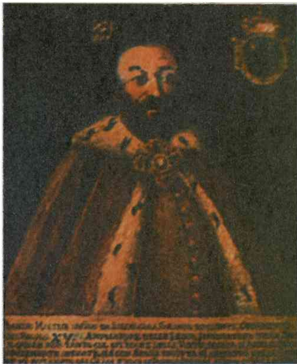
Fig.1. “Basilio Maltese” (Constantin Brâncoveanu)