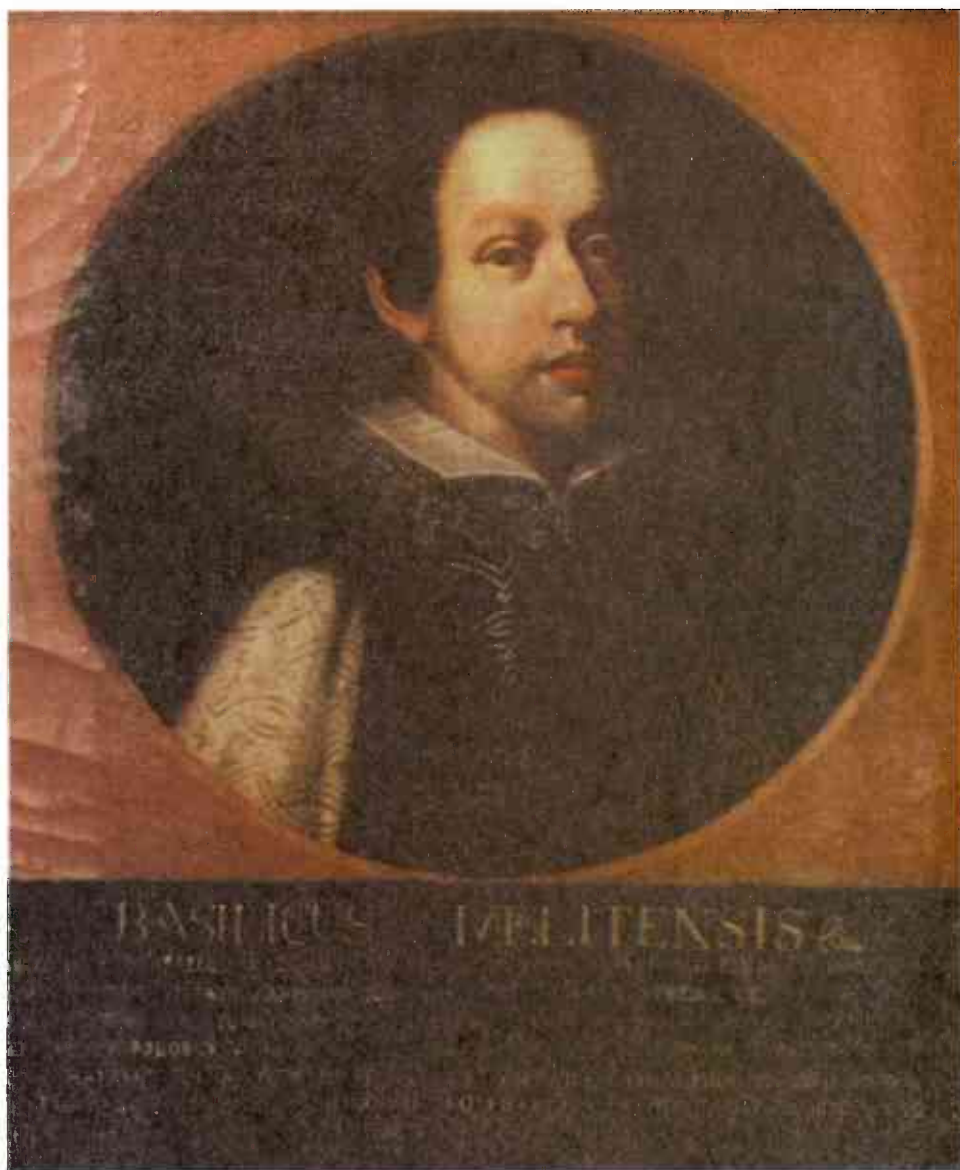
Fig 3. "Basilicus Melitensis" (Despot?)