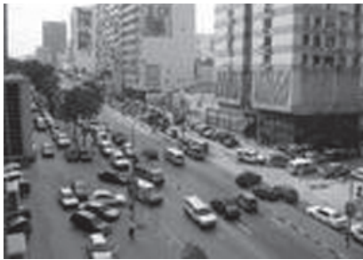
Hotel Tropico (foto din balcon)