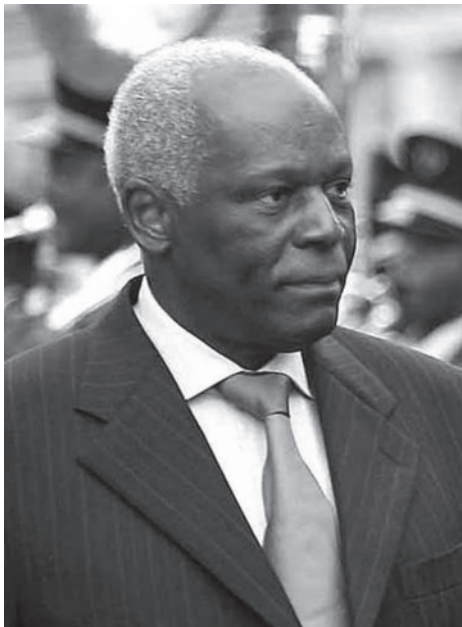
Jose Eduardo dos Santos

◆ Forțele militare implicate în războiul civil își aveau cartierele generale astfel: Forțele Armate Angoleze (FAA) în Luanda iar UNITA la Bailundo (cca. 120 km nord de Huambo).