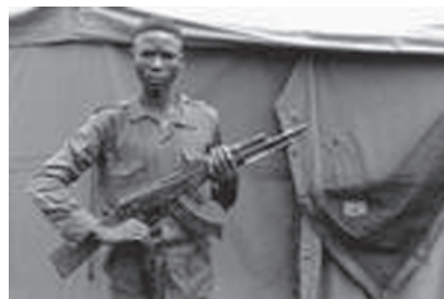
Soldat UNITA, recrutat la vârsta de 11 ani, așteptând demobilizarea. De remarcat modelul armamentului

- Școlile și cursurile de meserii pentru conversa profesională și integrarea în societate a foștilor combatanți UNITA au fost deschise de ONU cu întârziere (din cauza întârzierilor semnalate în deschiderea QA. Practic toți tinerii din UNITA erau luptători și după aproape 20 de ani de război nu cunoșteau altceva decât meseria armelor).