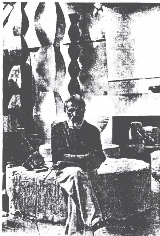
Brâncuși în atelier, 1933-1934

P. B. - Exact. Singurul conținut al acelor ani fusese forma. Or Brâncuși aduce nu numai elemente de ordin formal, el aduce simboluri, care se pierd în negura vremurilor. Cei mai mulți din artiști și critici au fost impresionaj de aportul lui Brâncuși la dezvoltarea unui limbaj. Nu e rău. Dar însemna foarte puțin în raport cu imensa bogăție a operei sale. Sper înă că s-a ieșit, în sfârșit, din această sminteală a avangarzilor, și Brancuși poate fi înțeles așa cum a fost. Un prooroc care anunța, într-un moment de rătăcire și aproape de vid, necesitatea de a redescoperi spiritualul și de a reda un sens artei. Or, aceste ateliere, încărcate de semnificații, ne permit să ne dăm seama cum Brâncuși a trăit un fel de spasm, de zbucium între ceea ce fi promitea cultura contemporană și ceea ce el știa, de la el din sat și, cu intuiția lui genială, considera superior.