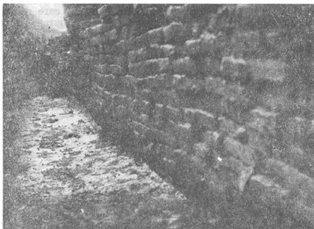
Fig. 1 — Zidul de incintă de pe latura estică a fortificației centrale.

Fortificația centrală a fost construită pe locul unui castru de pămînt datînd din vremea stabilirii romanilor în Dacia. Urmărind zidul de cărămidă al fortificației centrale (fig. 1) pentru a-i determina dimensiunile, tehnica de construcție, datarea și elementele sistemului defensiv, agger , berma , fossa , s-a constatat că temelia murus -ului a coborît pînă aproape de fundul șanțului de la vechea fortificație 15 .