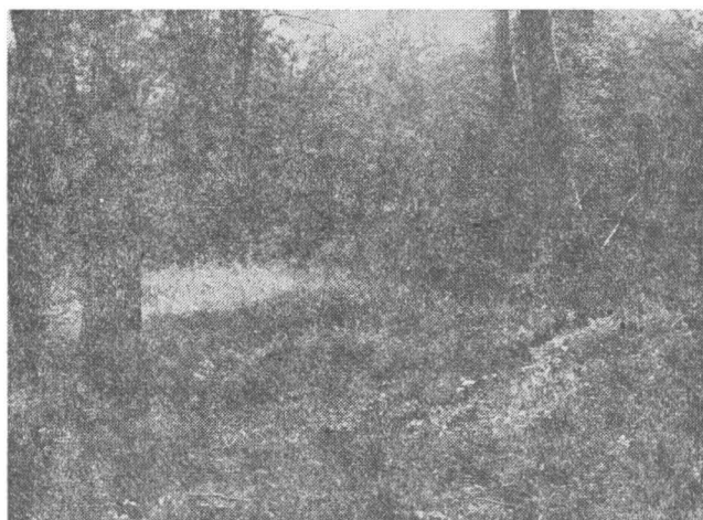
Fig. 4 — Traseul valului prin arături privit de pe măgura Piscului spre Greci.

Numerus surorum sagittariorum , care apare și sub denumirea de numerus surorum malvensium 24 se instalează la Romula 25 din timpul lui Antoninus Pius până la începutul sec. al III-lea e.n.