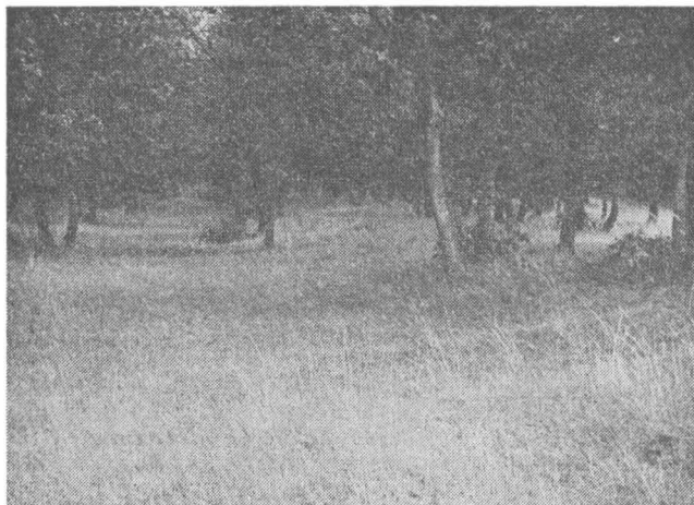
Fig. 3 — Valul și șanțul în mijlocul pădurii Episcopiei.

Permanent în garnizoana Romula-Malva au staționat numai trupe auxiliare. Aici se stabilește și rămâne în armata Daciei Inferioare, unde este menționată în 140 22 , cohors I Flavia Commagenorum 23 .