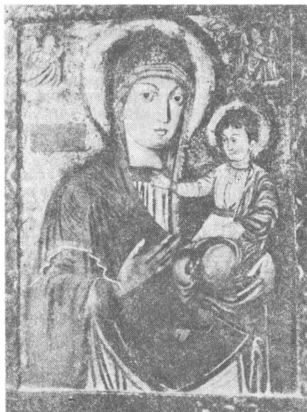
Fig. 8 — „Maica Domnului cu pruncul“. Luca din Iclodul Mare, 1681. Transilvania, Nicula, biserica ortodoxă.