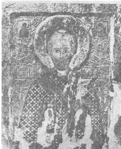
Fig. 1 — „Sf. Nicolae”. Stroe din Tîrgoviște, 1644. Mănăstirea Arnota, jud. Vîlcea (în prezent la Muzeul de Artă al R. S. România).

Trecerea noului stil în Țara Românească are loc, după datele de care dispunem în momentul de față, nu mai devreme de deceniul al patrulea al sec. al XVII-lea. Dacă este să luăm în considerație datarea celor mai vechi icoane munteștii, păstrate și cunoscute pînă astăzi, lucrate în stilul decorativ cu motive incizate, atunci momentul pe care-l avem în vedere s-ar putea plasa către 1640. Într-adevăr, cele mai vechi icoane, lucrate la sud de Carpați, cu ornamente vegetal-florale incizate, par a fi, pînă în prezent, cele datate în 1640—1644, reprezentînd pe Sf. Nicolae (fig. 1), Arhanghelul Mihail, Iisus Hristos Pantocrator și Maica Domnului cu pruncul 12 . Toate sînt opere ale zugravului Stroe din Tîrgoviște 13 , realizate din porunca domnului țării, Matei Basarab, pentru ctitoria sa, mănăstirea Arnota.