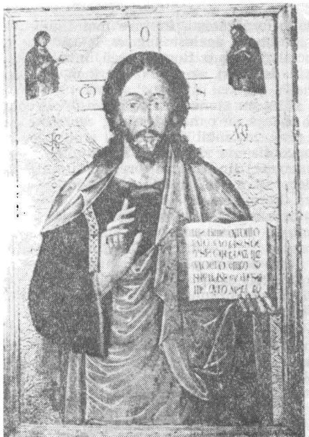
Fig. 7 — „Iisus Hristos Pantocrator“. Maler Baraski, 1643. Provine de la Vinători, jud. Neamț (în prezent la mănăstirea Neamț).