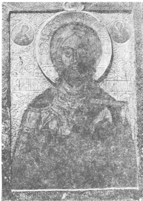
Fig. 2 — „Iisus Hristos Pantocrator”. Atelierul din Tîrgoviște, 1644—1650 (1651). Biserica din Simburești, jud. Olt.