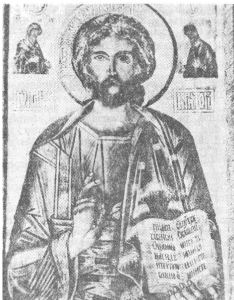
Fig. 9 — „Iisus Hristos Pantocrator“. Constantin zugravul, 1654. Hunedoara, biserica Sf. Nicolae.