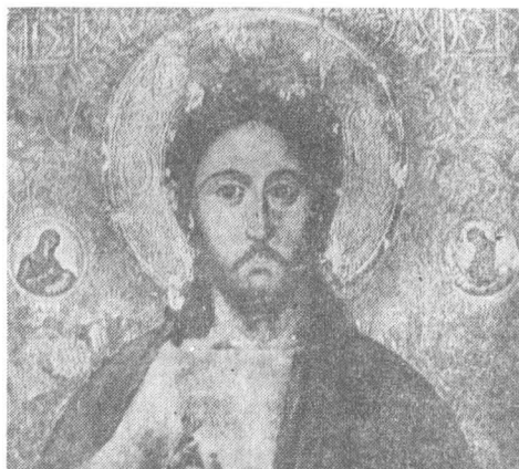
Fig. 5 — „Iisus Hristos Pantocrator”. Detaliu. Moldova, 1666 (colecția Mitropoliei Moldovei).

Ne facem o datorie din a preciza că regăsirea, într-un ornament, a unei forme florale din realitate, prin care acesta poate fi, în mod expres, definit, este un lucru, de multe ori, posibil, alături, însă, destul de delicat, purtând oarecum pecetea convenționalului. Faptul își găsește explicația în maniera și măsura în care respectivul ornament este stilizat de un meșter sau altul, precum chiar și de unul și același zugrav iconar. De asemenea, parte dintre ornamentele în discuție, prin redarea artistică transfigurat-sintetică, fie că își pot găsi corespondențe chiar mai numeroase, decât am menționat noi, în flora reală, fie că, dimpotrivă, se îndepărtează, mai mult sau mai puțin, de un model real foarte tranșat.