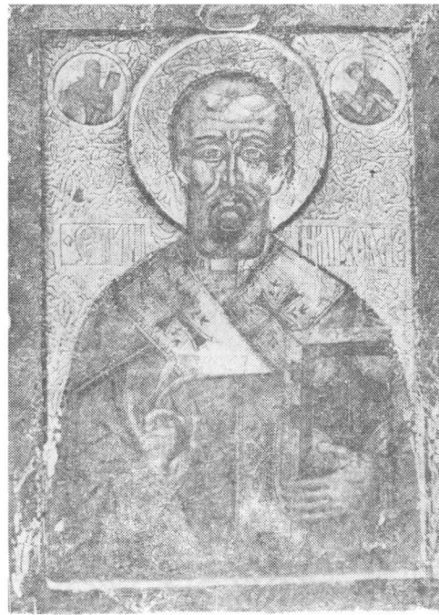
Fig. 4 — „Sf. Nicolae”. Atelierul din Tîrgoviște, 1644—1650 (1651). Biserica din Simburești, jud. Olt.