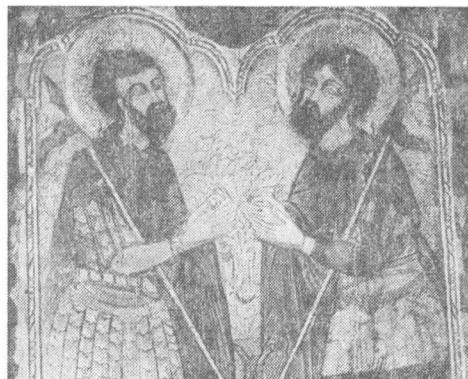
Fig. 6 — „Sfinții Teodor Tiron și Teodor Stratilat”. Detaliu. Grigorie din Bierilești, 1665. Biserica Sfinții Teodori, Iași.

Rămâne, însă, oricum, de subliniat faptul că în ornamentală unul dintre imperatiile artistice ale vremii îl constituie apropierea, mai declarată decât pînă acum, de realitate, prin tendința contrabalansării non-figurativului geometric de către ornamentală figurativă vegetal-florală, cu sau fără tendințe geometrizante, care ce va fi continuată și chiar amplificată în deceniile de la sfîrșitul sec. al XVII-lea și în sec. al XVIII-lea 22 . Climatului acestor exprimări decorative este conferit de