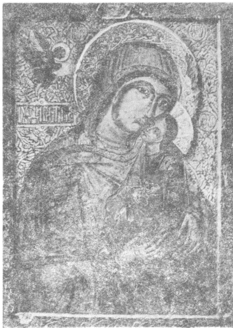
Fig. 3 — „Maica Domnului cu pruncul”. Atelierul din Tîrgoviște, 1644—1650 (1651). Biserica din Simburești, jud. Olt.