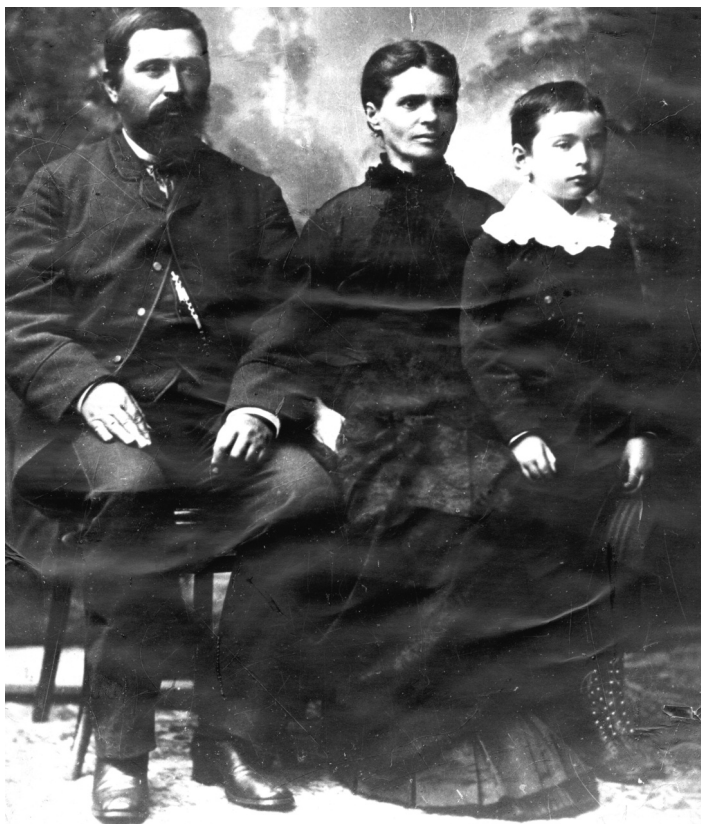
George Enescu alături de părinți. Fotografie alb-negru. (Patrimoniul MNIR).

George Enescu with his parents. Black-and-white photo (MNIR patrimony).