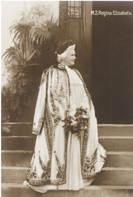
Regina Elisabeta, suverană a Regatului României și protectoare a artelor. Fotografie, sepia. (Patrimoniul MNIR). Queen Elisabeth, sovereign of the Romanian Kingdom and a protector of the arts. Photo, sepia. (MNIR patrimony).