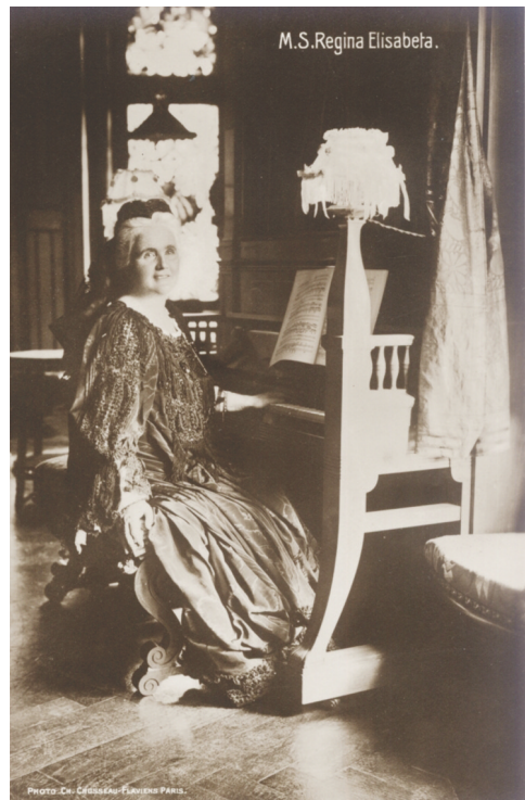
Regina Elisabeta, patroana compozitorului, în sala de muzică a castelului Peleş. Fotografie, sepia. Queen Elisabeth, the composer's patron in the music room of Peleş Castel. Photo, sepia.