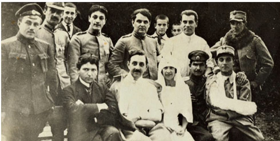
Fotografie alb-negru. George Enescu în mijlocul ofițerilor ruși și români la un spital militar din Moldova. Fotografie alb-negru.

George Enescu among Russian and Romanian officers at a military hospital in Moldova. Black-and-white photo.