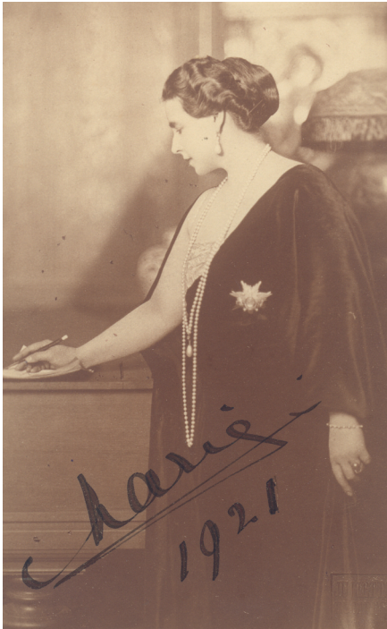
Fotografie cu autograful Reginei Maria, 1921.

A photo of Queen Marie with her autograph, 1921. (MNIR patrimony).