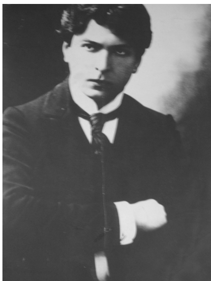
George Enescu. Fotografie alb-negru.

George Enescu with his parents. Black-and-white photo.