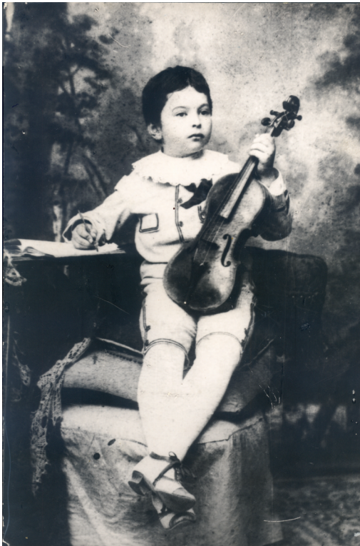
Micul geniu și vioara lui. Fotografie alb-negru (Patrimoniul MNIR).

The little genius and his violin. Black-and-white photo. (MNIR patrimony).