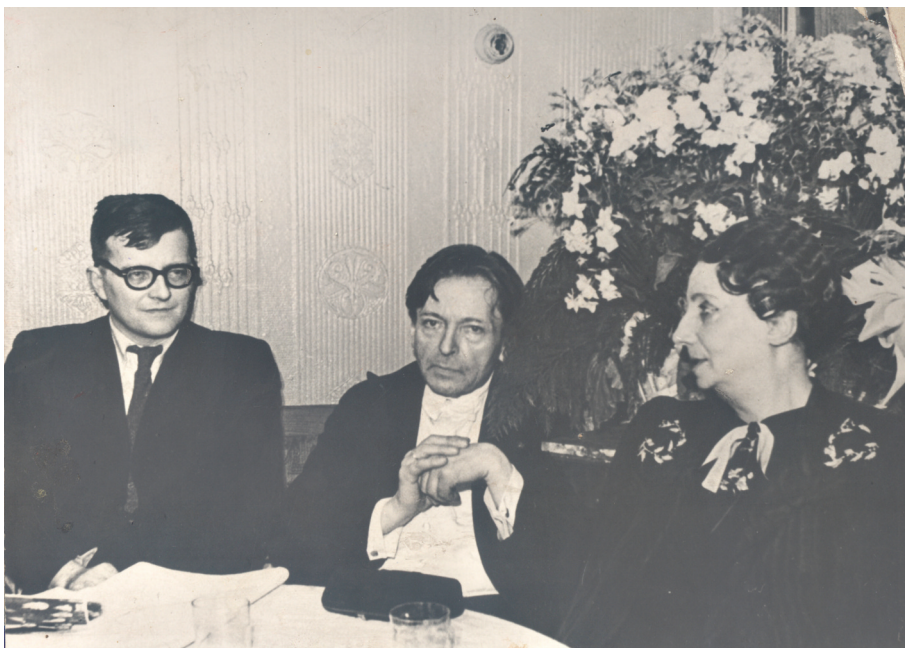
George Enescu alături de Maruca și D. Chostakovici. Fotografie alb-negru (Patrimoniul MNIR).

George Enescu with Maruca and D. Șostakovici in Moscow. Black-and-white photo. (MNIR patrimony).