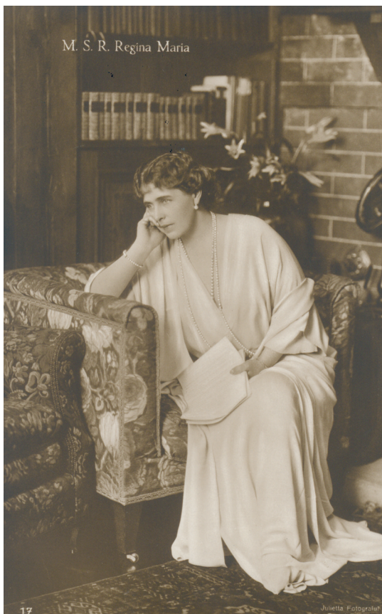
Regina Maria, suverana care i-a apreciat modestia și generozitatea. Carte poștală, sepia.

George Enescu among Russian and Romanian officers at a military hospital in Moldova. Black-and-white photo (MNIR patrimony).