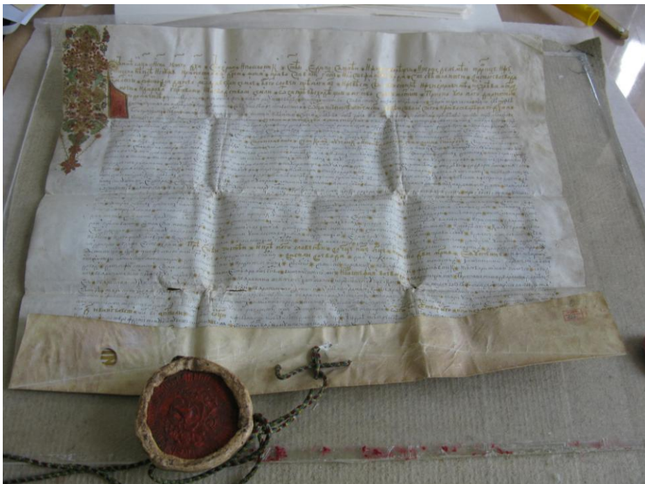
Fig.1 Pergamentul după rehidratat; The parchment after rehydration