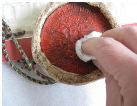
Fig.2 Lacună; Lacuna; Fig. 3 Curățirea pecetii; The cleansing of the seal