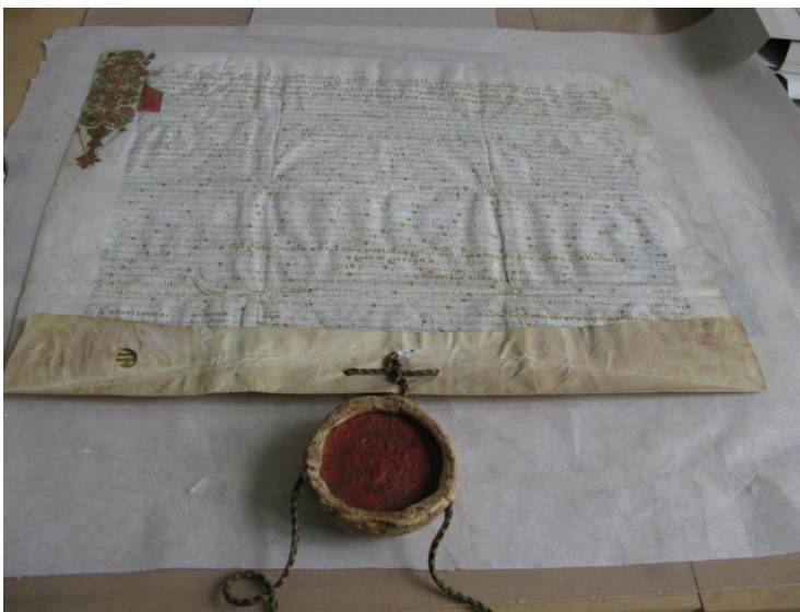
Fig.5 Documentul înainte de montare în passepartout; The document before being framed in a passepartout