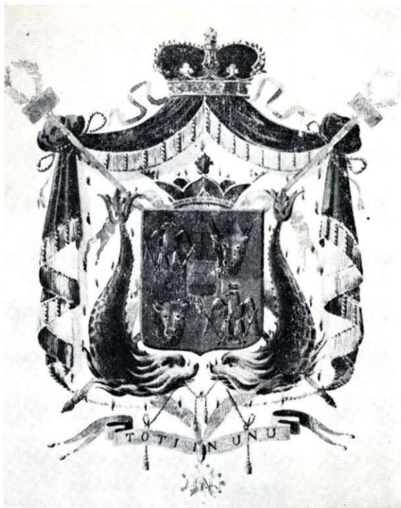
Fig. 2 a. Stema Principatelor Unite alcătuită de pictorul Carol Pop de Szathmary în 1863, care are la bază desenul decorației.