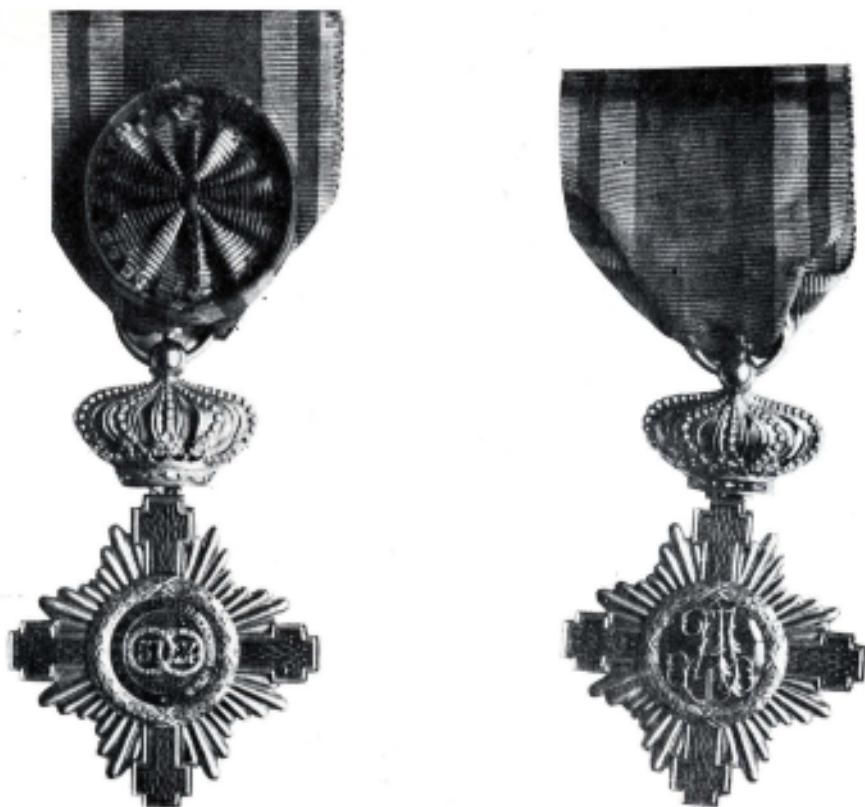
Fig. 4 a și 4 b. Decorația „Ordinului Unirii“ în gradul de ofițer executată la casa Kretly din Paris în 1864, avers și revers.