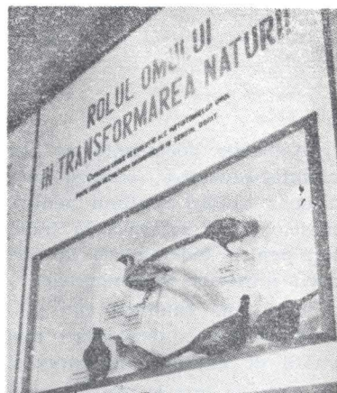
Fig. 2 — Expoziția de bază — secția de transformare și ocrotire a naturii.

deauna să completeze expunerea tridimensională, spațială a pieselor de muzeu. Prin specificul său, secția de evoluționism a muzeului nostru necesită îndrumarea grupurilor în fața dioramelor și a celorlalte mijloace de prezentare a datelor despre originea și evoluția vieții și a omului în cursul erelor geologice. Priceperea noastră, a muzeografilor, constă în ușurința de a ne adapta ghidajul corespunzător nivelului de vîrstă și pregătire a vizitatorilor (5, 7).