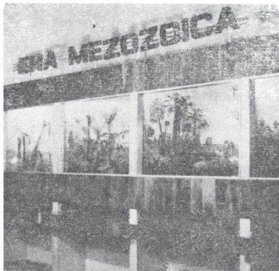
Fig. 1 — Expoziția de bază — aspect din secția de evoluționism.

Expoziția de bază , prin tematica sa, oferă informații pe care prin lectură le poți aduna din multe tomuri, expunerea muzeală constînd în prezentarea noțiunilor abstracte sub forma argumentelor reale, sintetizate. Legătura cu publicul este realizată în cadrul acestei expoziții prin ghidajele care urmăresc întot-