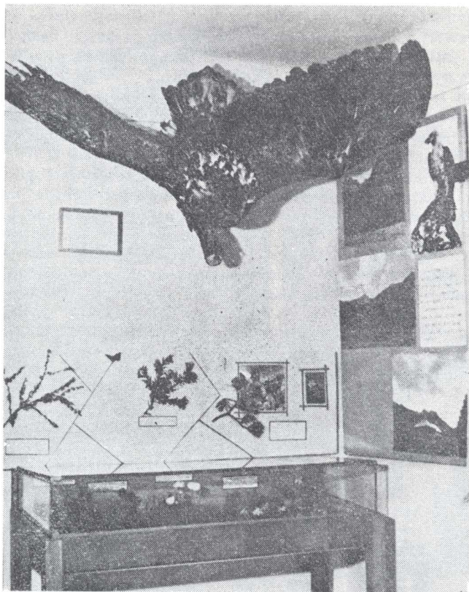
Fig. — 4 Aspect din expoziția muzeală permanentă de la Cheia.

Expozițiile itinerante constituie o contribuție de seamă a muzeului la educarea maselor, la formarea și dezvoltarea conștiinței socialiste. Multe din expozițiile temporare organizate de muzeu au fost refăcute într-o formă care să poată fi