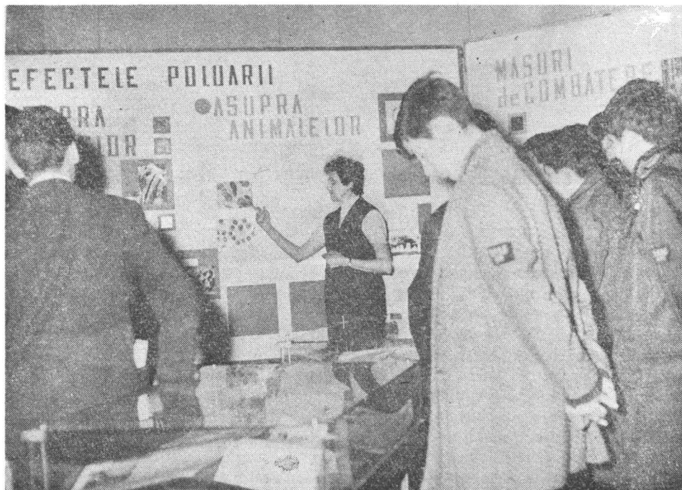
Fig. 8 — Expoziția temporară itinerantă: „Poluarea și combaterea ei”.

Pentru continua îmbogățire a formelor activității cultural-educative, am organizat sondaje de opinii , mai ales în rîndul tineretului, întrebările formulate avînd