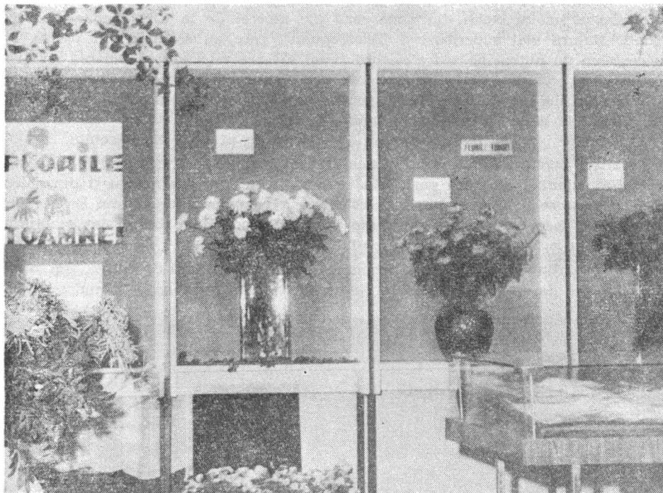
Fig. 7. — Expoziția temporară : „Florile toamnei”.

O formă des folosită a activității cultural-educative a muzeului nostru sînt conferințele și simpoziioanele care în medie au atins un număr de 60 anual, subiec-