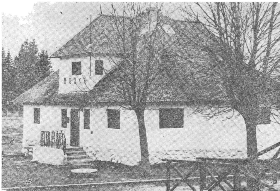
Fig. 3 — Expoziția muzeală permanentă din stațiunea Cheia : „Natura văii superioare a Teleajenului“.

— expoziții temporare cu caracter informativ și pentru educarea simțului estetic legat de elementele naturii : expozițiile floricole cu material natural „Flor'71“, de mare amploare și „Flori de toamnă“ într-un cadru mai restrâns, organizată