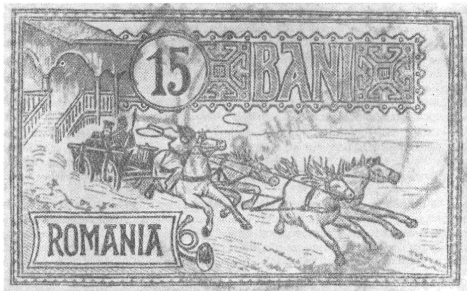
Fig. 2 — Timbru poștal din seria „Căișorii“.

În vechea clădire funcționa din anul 1893 o centrală telefonică cu capacitatea de 300 linii. Centrala ajungînd să fie complet ocupată, în noul palat se instalează un multiplu telefonic de 3 000 linii. Acest multiplu, atunci de cel mai nou tip produs de marea întreprindere Western Electric din Statele Unite, a fost adus în Europa și expus la expoziția internațională din Paris de unde a și fost cumpărat. Astfel, în acea vreme, Palatul Poștelor poseda cea mai modernă instalație de telefonie din Europa.