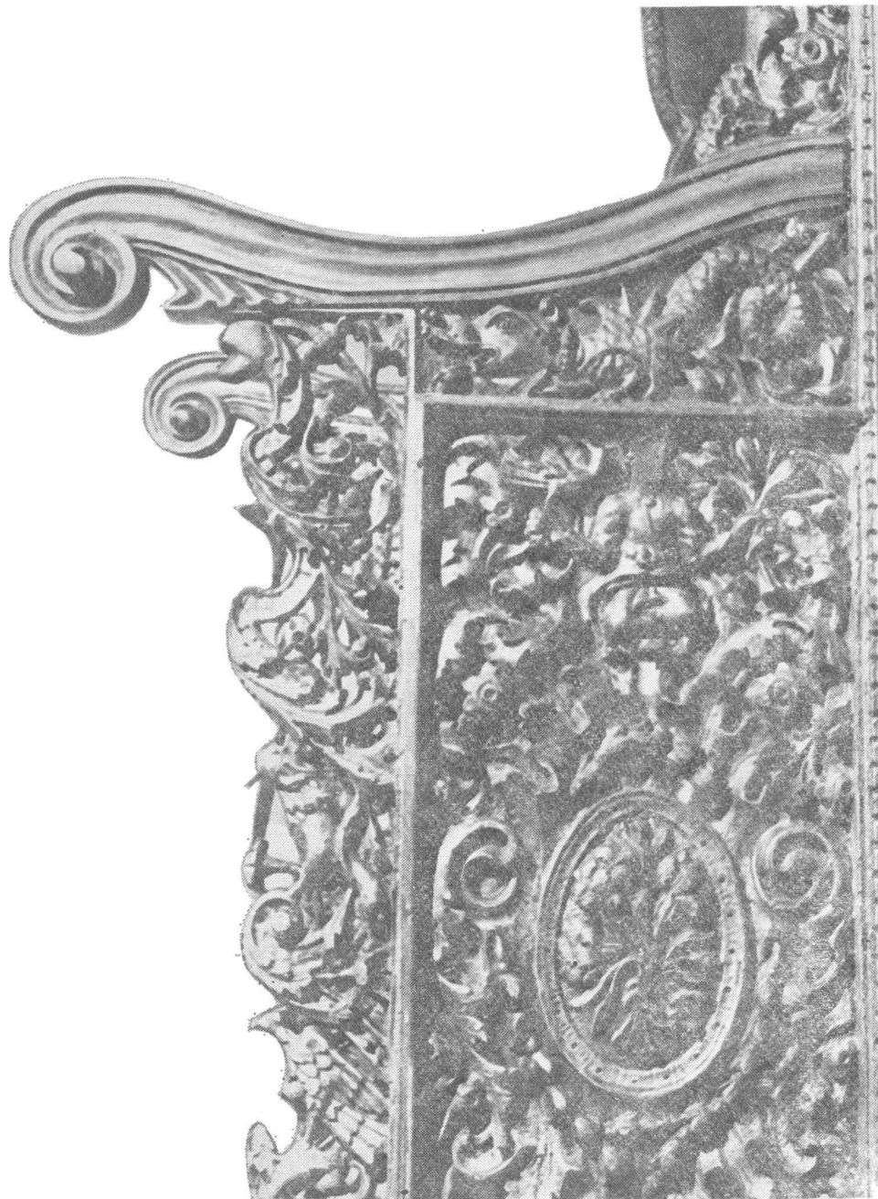
Fig. 5 — Jilțul domnesc (1767), fotografie detaliu (braț lateral) după restaurare.