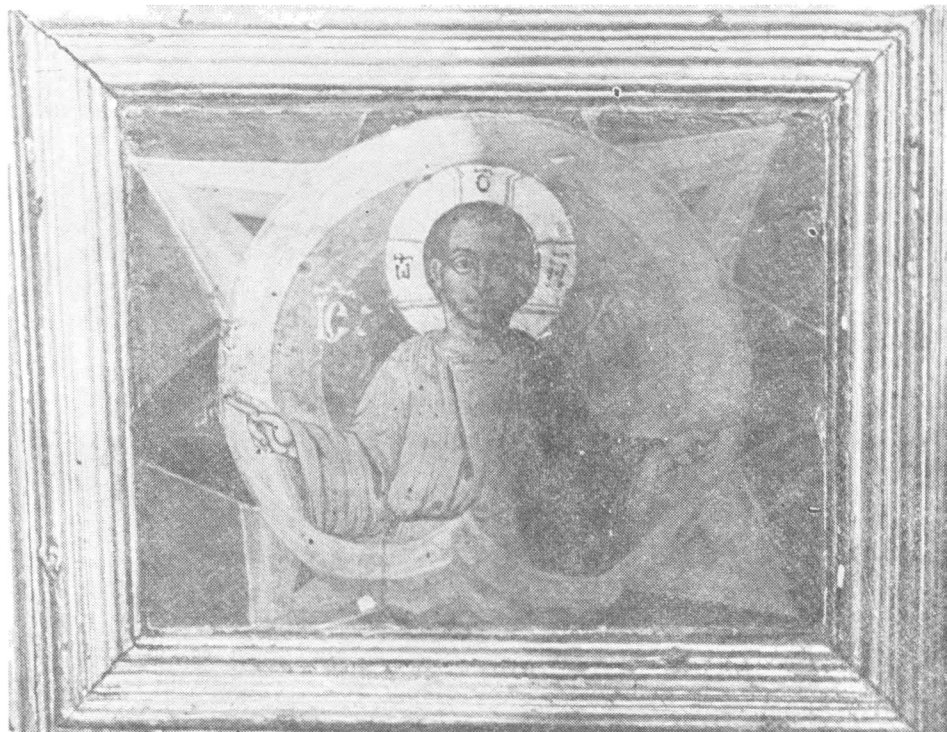
Fig. 4 — Jilțul domnesc (1767), fotografie detaliu (partea superioară) în timpul restaurării.

În cazul în care completările nu au fost obligatorii nu s-a intervenit asupra elementelor de detaliu, ci s-a urmărit să se redea, în mare, forma detaliului lipsă.