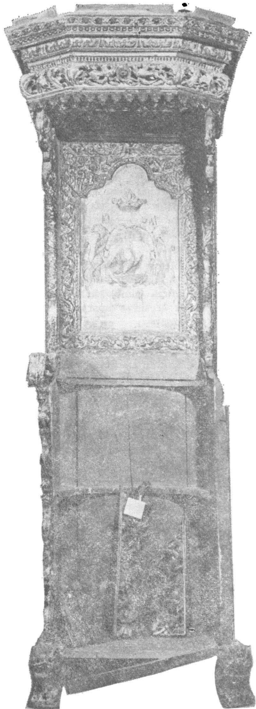
Fig. 1 — Juilțul domnesc (1767) înainte de restaurare, fotografie de ansamblu față.