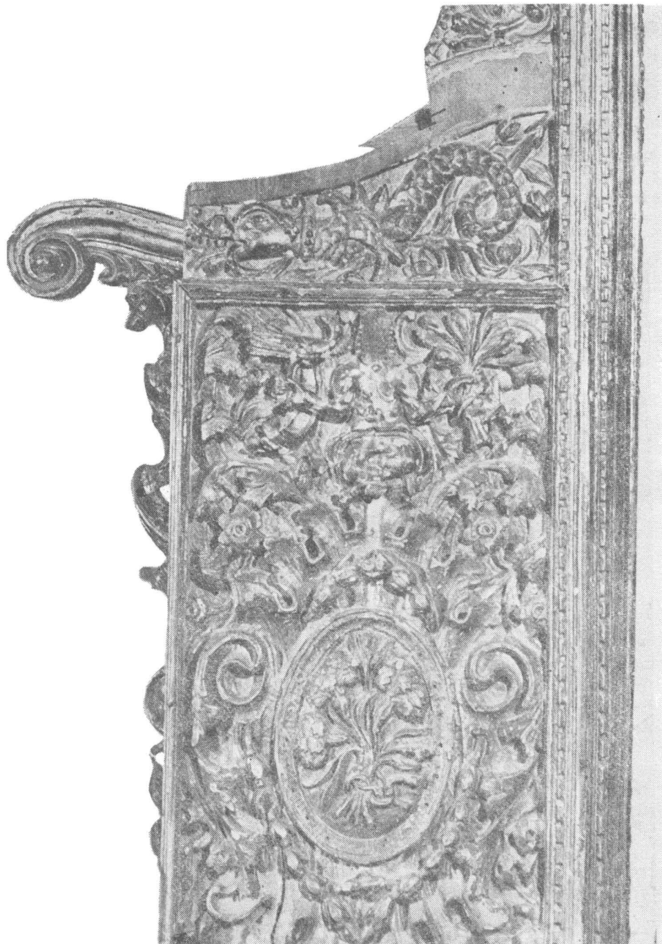
Fig. 2 — Jilțul domnesc (1767), fotografie detaliu lateral, înainte de restaurare; se observă brațul lipsă.