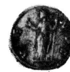
Fig. 3. — Monede din tezaurul de la Bîrgăoani (nr. 23—33).