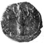
Fig. 2. — Monede din tezaurul de la Bîrgăoani (nr. 12—22).