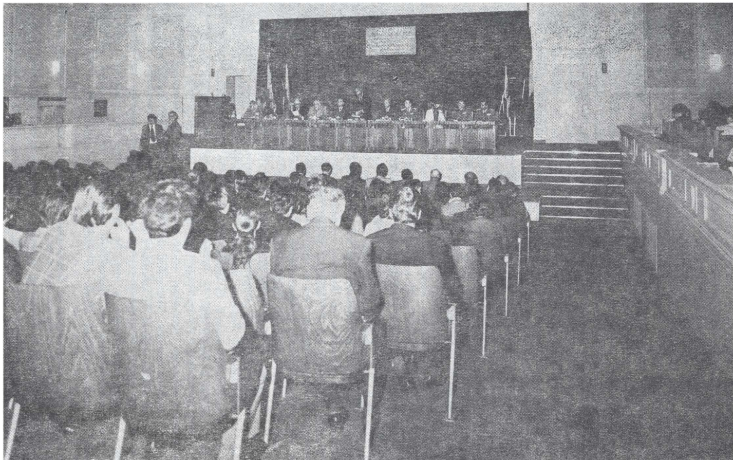
Imagine din timpul lucrărilor ședinței plenare a Sesiunii.