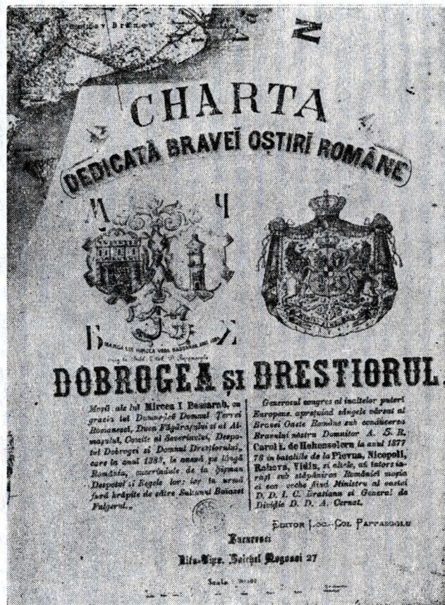
Fig. 6 — Hartă editată în 1877 de lt. col. Pappasoglu.