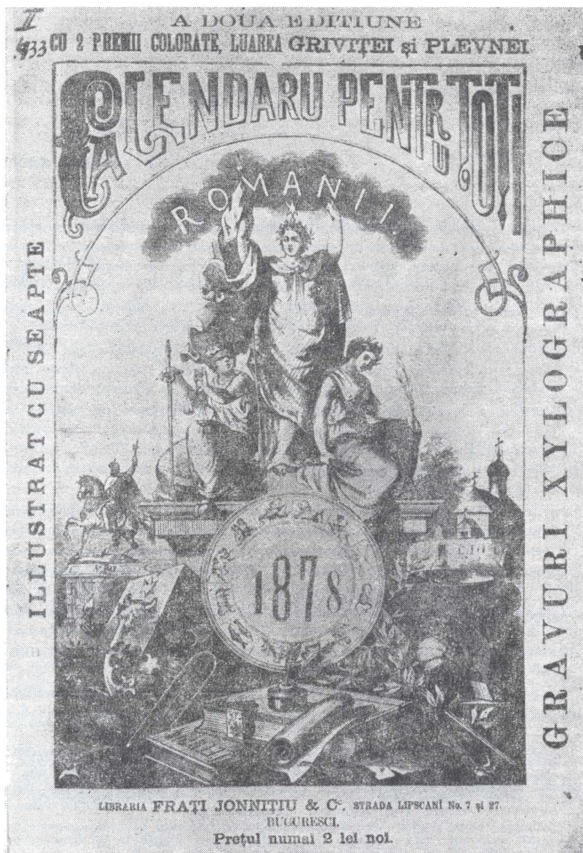
Fig. 1 — Calendar editat de publicistul N. D. Popescu.

tipografii 5 . Radicalizarea atitudinilor și mai ales deplasarea vizibilă a centrului de preocupări spre aspecte de interes național au determinat forțele politice ale vremii să asigure organelor de presă condiții materiale, iar tematica să corespundă și intereselor de