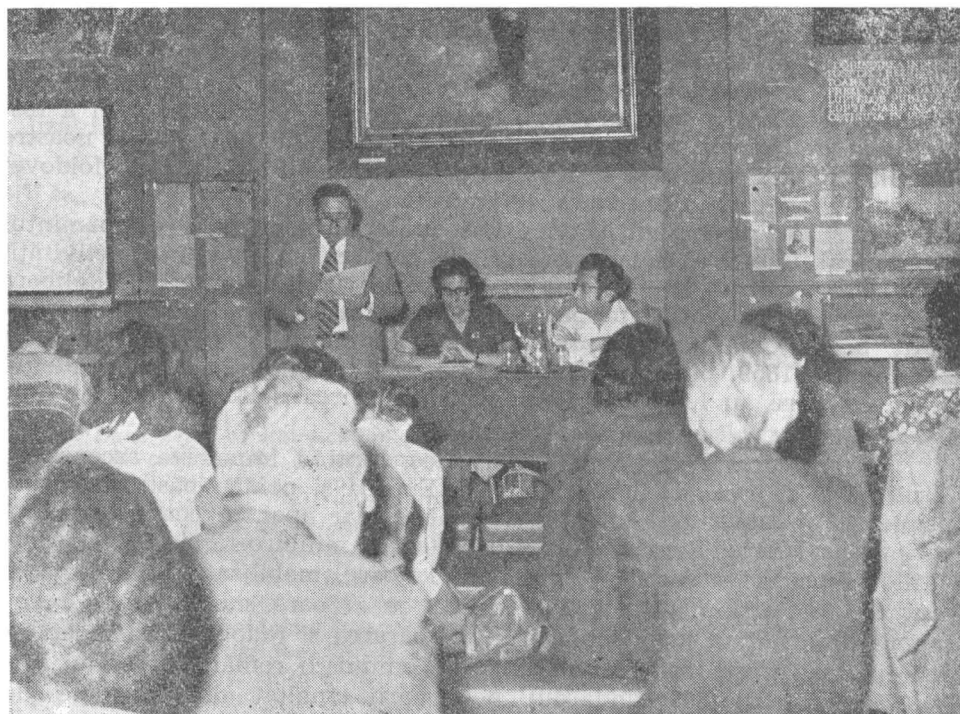
Fig. 8 — Imagine din timpul lucrărilor secției a IV-a — istorie contemporană.