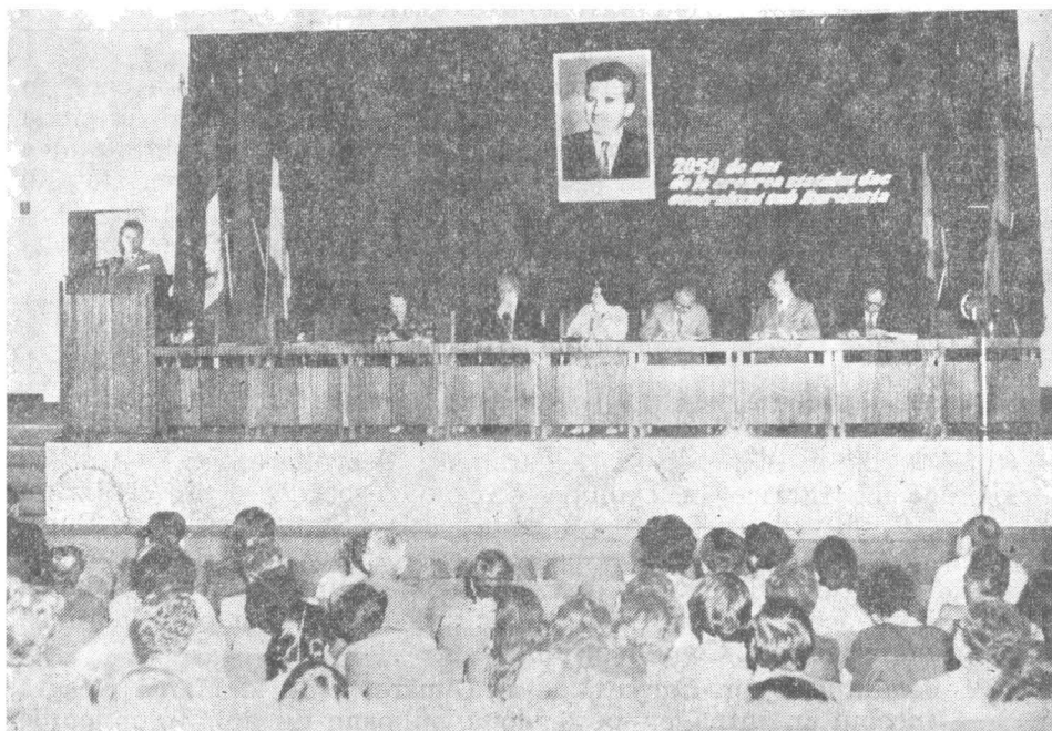
Fig. 5 — General-major Ilie Ceaușescu prezentându-și comunicarea în ședința plenară a sesiunii.