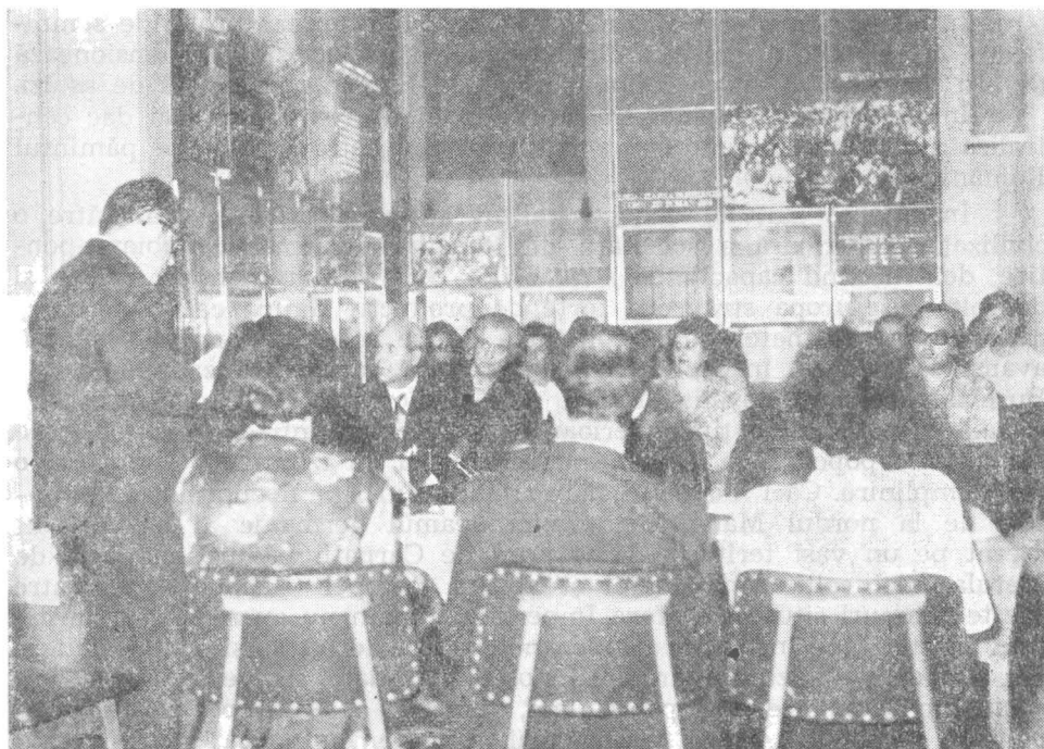
Fig. 4 — Imagine din timpul lucrărilor secției I-a — istorie veche.