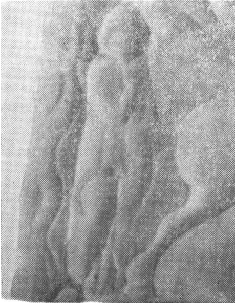
Fig. 1 b