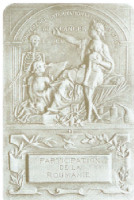
Fig. 6. Plachetă – A II-a Conferință Internațională pentru Studiul cancerului, Paris, 1910. Avers, Revers.

Plaque – The 2 nd International Conference for the Study of Cancer, Paris, 1910. Obv., Rev.