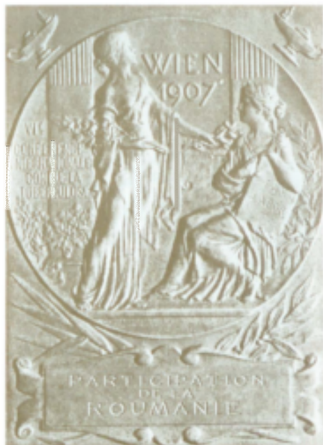
Fig. 4. Plachetă – A VI-a Conferință Internațională contra tuberculozei – Viena, 1907. Avers, Revers.

Plaquette – The 6 th International Conference against Tuberculosis, Vienna, 1907. Obv., Rev.