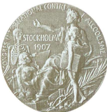
Fig. 5. Medalie – Al XI-lea Congres Internațional contra Alcoolismului, Stockholm, 1907. Avers, Revers.

Medal – The 11 th International Congress against Alcoholism, Stockholm, 1907. Obv., Rev.