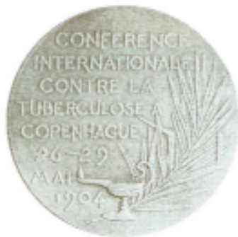
Fig. 1. Medalie – Conferința Internațională contra tuberculozei, Copenhaga, 26-29 mai, 1904. Avers, Revers.

Medal – The International Conference against Tuberculosis, Copenhagen, 1904. Obv., Rev.