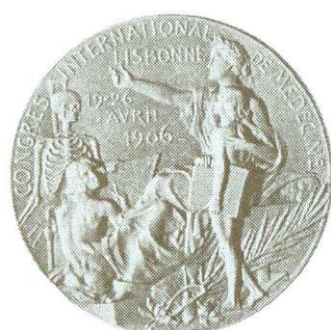
Fig. 3. Medalie – Al XV-lea Congres Internațional de medicină, Lisabona, 19-26 aprilie, 1906. Avers, Revers.

Medal – The 15 th International Congress of Medicine, Lisbon, 1906. Obv., Rev.