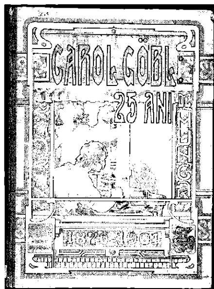
Fig. 1. Coperta cărții „O pagină din istoria tipografiei române contemporane. Tipograful Carol Göbl...”, București, 1901.

La reliure du livre „O pagină din istoria tipografiei române contemporane. Tipograful Carol Göbl...” [„Une page de l'histoire de la typographie roumaine contemporaine. Le typographe Carol Göbl...”], Bucarest, 1901.