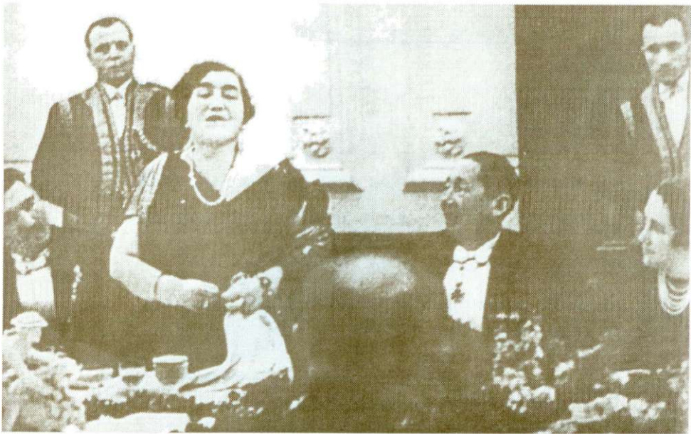
Fig. 4. Elena Văcărescu și Nicolae Titulescu la Legația României de la Paris. Hélène Vacaresco et Nicolas Titulesco à la Legation de la Roumanie à Paris.

Nicolas Titulesco en costume de diplomat et portant l'Ordre Royal Victorien pendant sa mission à Londres.