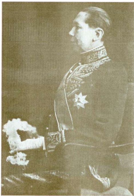
Fig. 3. Nicolae Titulescu în costum de diplomat și purtând Ordinul Regal Victorian – în timpul misiunii la Londra.

Nicolas Titulesco en costume de diplomat et portant l'Ordre Royal Victorien pendant sa mission à Londres.