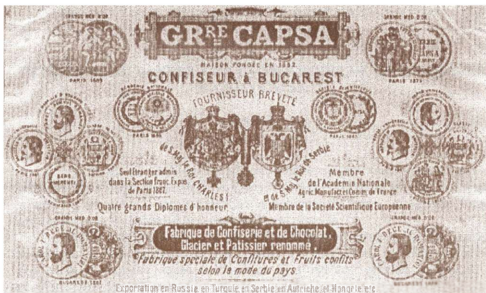
Frontispiciu de factură cu titulatura firmei lui Grigore Capsa, după 1889.