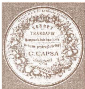
Etichetă realizată după litografia lui G. Voneberg, pentru șerbet de trandafiri, unul din produsele Casei Capsa. Sfârșitul secolului al XIX-lea.