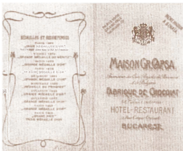
Projet de menu-réclame pour „La Maison Gr. Capsa”. Environ 1900.