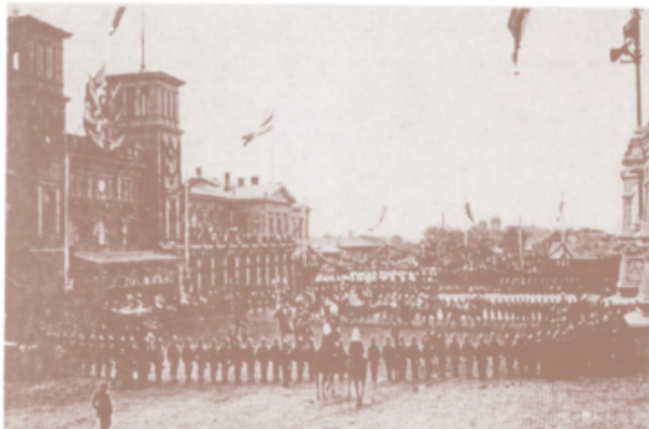
Primirea Împăratului Austro-Ungariei Franz Josef I în Gara de Nord din București. Septembrie 1896.

L'arrivée de l'Empereur François-Joseph I er de l'Autriche-Hongrie à la Gare du Nord de Bucarest. Septembre 1896.