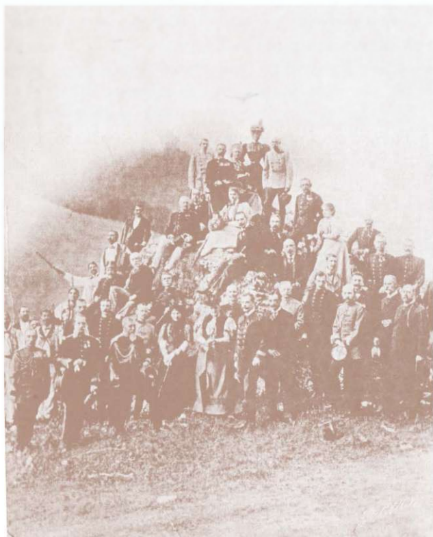
Împăratul Franz Josef I, familia regală a României, personalități civile și militare românești și străine la Sinaia, septembrie 1896. Stâncă din imagine a primit numele suveranului austro-ungar. L'Empereur François-Joseph I, la famille royale de la Roumanie, des personnalités civiles et militaires roumaines et étrangères à Sinaia. Septembre 1896. Le rocher de l'image a reçu le nom du souverain d'Autriche-Hongrie.