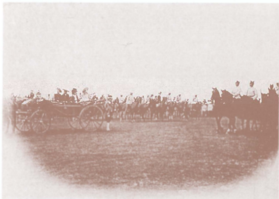
Defilarea trupelor cu ocazia vizitei Împăratului Franz Joseph I în România în prezența acestuia și a familiei regale a României. Septembrie 1896.

L'arrivée de l'Empereur François-Joseph I er de l'Autriche-Hongrie à la Gare du Nord de Bucarest. Septembre 1896.