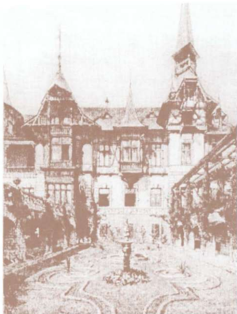
Castelul Peleş, fațada de est. După o acuaforte, 1892. Le Château de Peleş, la façade d'est. D'après une aquaforte, 1892.