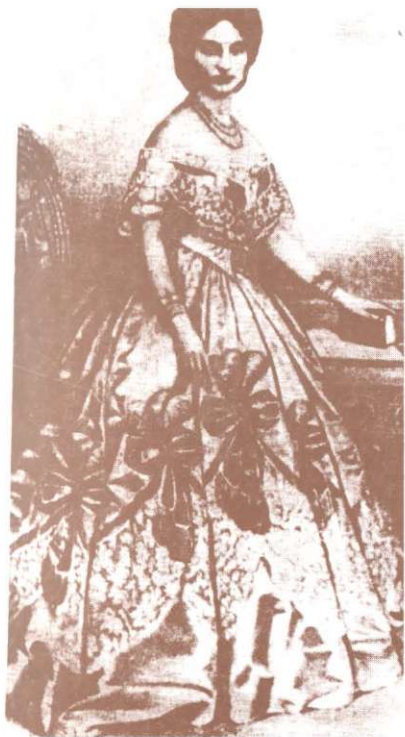
Rochie cu crinolină purtată de Elena Cuza. Robe à crinoline de Hélène Couza.