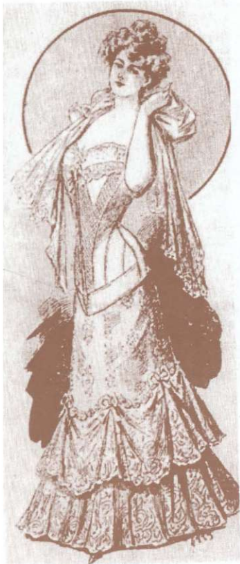
Corset. Jurnalul "La Mode", 1/1900. Corset. Le journal "La Mode", no. 1/1900.