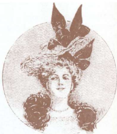
Pălărie. Jurnalul "La Mode", 1/1900. Chapeau. Le journal "La Mode", no. 1/1900.