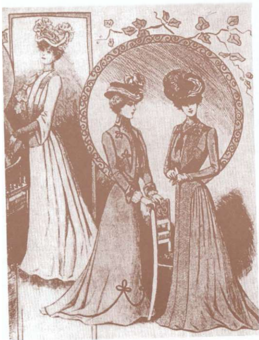
Modele din jurnalul "La Mode", 1/1900. Des modèles du journal "La Mode", no. 1/1900.