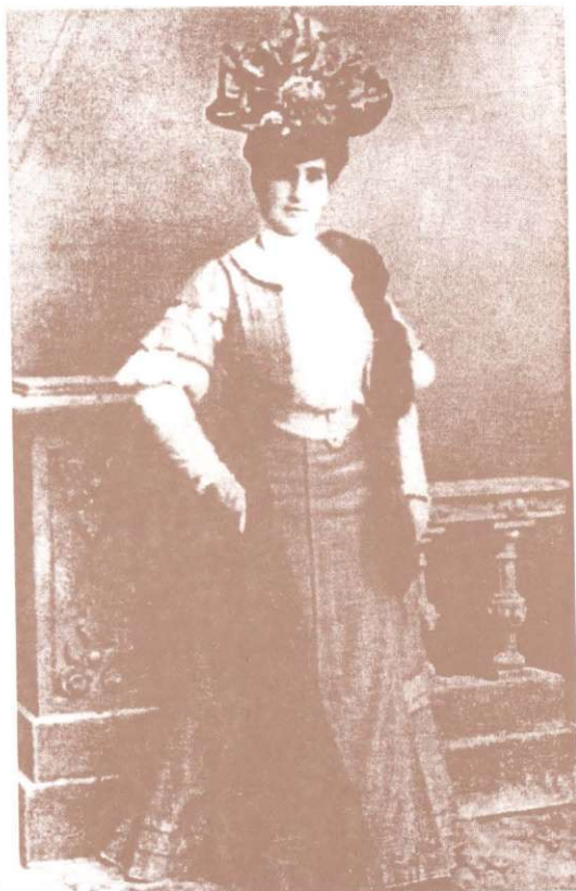
Costumul bucureștean, 1900. Costume bucarestais, 1900.