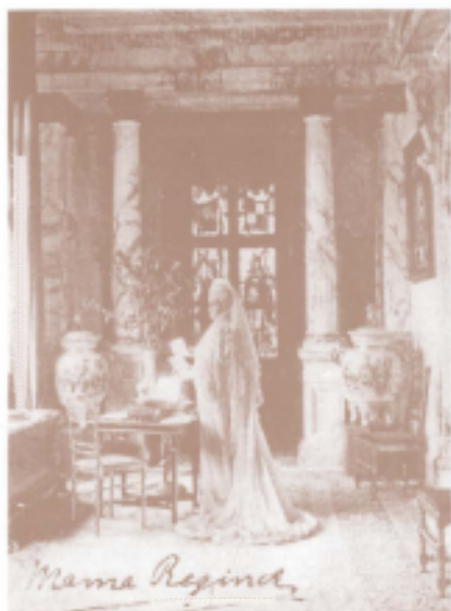
Regina Elisabeta (Carmen Sylva) în camera de lucru a castelului Peleş, Sinaia.

La reine Elisabeth (Carmen Sylva) dans sa chambre de travail du Château Peleş de Sinaia.