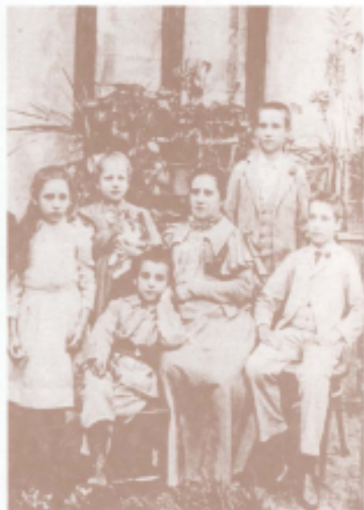
O familie din Iași la 1880. Une famille de Iassy en 1880.

La reine Elisabeth (Carmen Sylva) dans sa chambre de travail du Château Peleş de Sinaia.