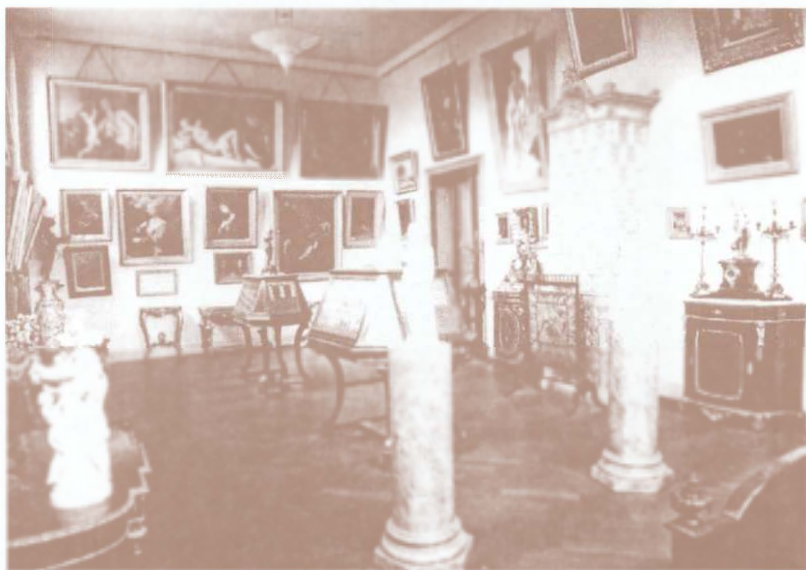
Aspect interior din palatul Dinu Mihail, Craiova, inaugurat în 1909.

La princesse Elisabeth en costume populaire roumain.