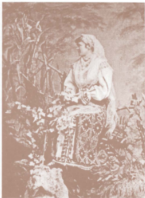
Principesa Elisabeta în costum popular românesc.

Le prince Charles I en tenue de jour, au commencement du son règne.