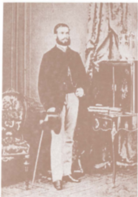
Principele Carol I în ținută de zi, la începutul domniei.

Le prince Charles I en tenue de jour, au commencement du son règne.