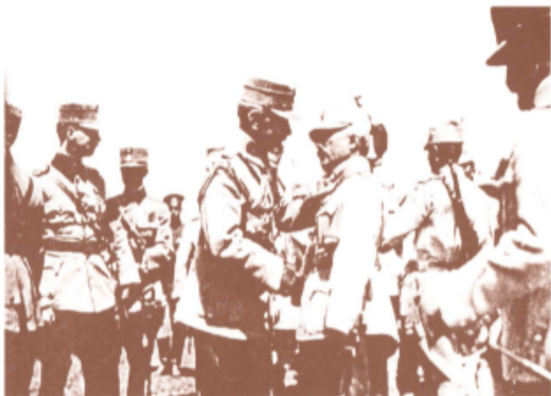
Principele moștenitor Carol, generalul Prezan și un grup de ofițeri Le prince héritier Charles, le général Prezan et un groupe d'officiers.