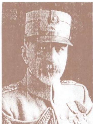
General de Corp de Armata Prezan Constantin General de Divizie 14/8 1916, C.A. 27/10 1917. C.A. 1918-1919.

Generalul Constantin Prezan decorat cu Ordinul militar "Mihai Viteazul" clasa a III-a, a II-a, a I-a.