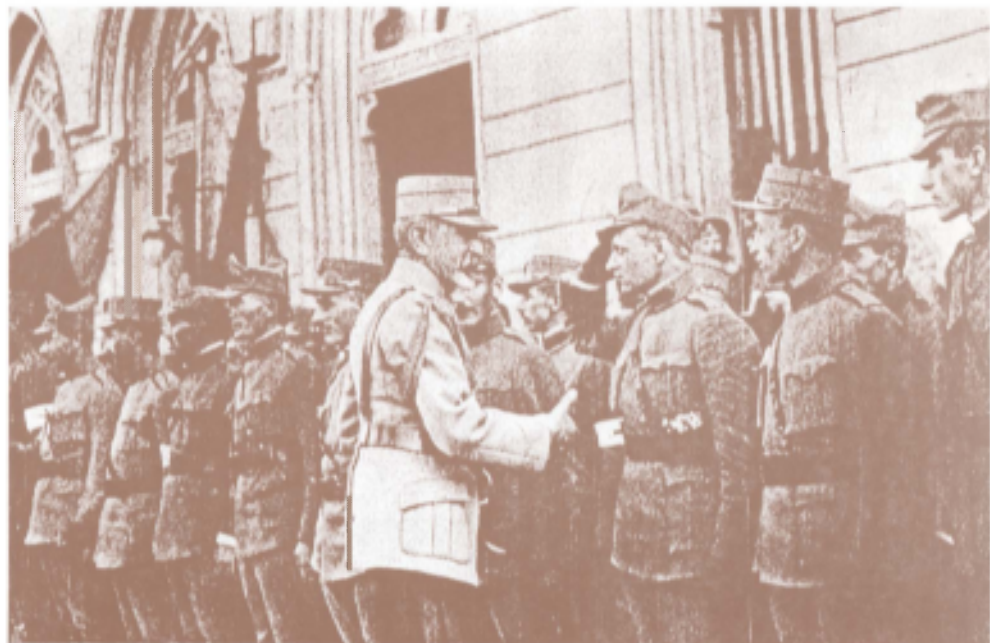
Generalul Prezan urând <bun venit> ofițerilor ardeleni, iunie 1917, Iași Le général Prezan, disant "bien venu" aux officiers de Transylvanie, juin 1917, Iassy.