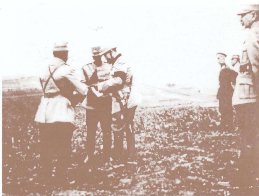
Regele Ferdinand, generalul Constantin Prezan și generalul Henri Berthelot la Onești. Le roi Ferdinand, le général Constantin Prezan et le général Henri Berthelot à Onești.