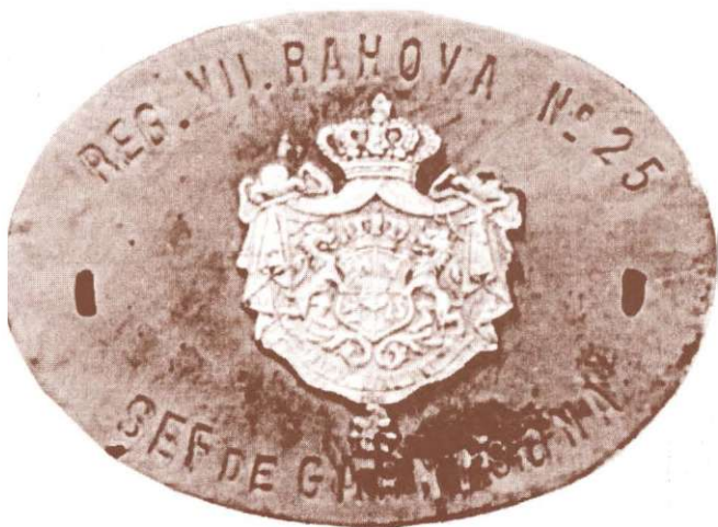
Ecusonul Regimentului VII Racova nr. 25 Vaslui L'écusson du régiment VII Racova no. 25 Vaslui