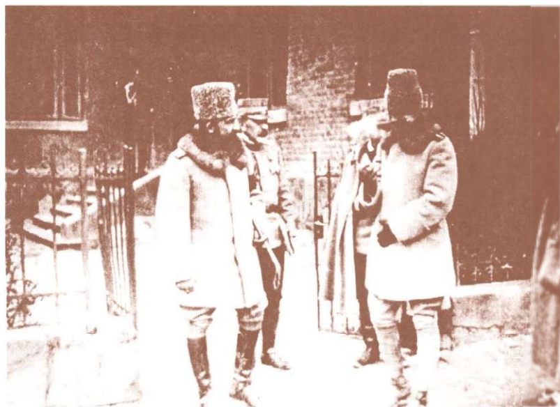
La Marele Cartier General, 28 martie 1918. Au Grand Cartier Général, 28 mars 1918.