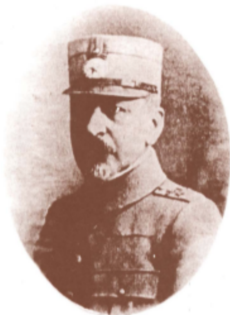
Constantin Prezan Șeful Marelui Stat Major Constantin Prezan, le chef du Grand Etat Majeur