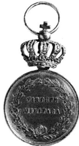
Medalie-decorație, Virtutea militară , 1864, avers și revers (cat. 42). Médaille-décoration, La Vertu Militaire , 1864, droit et revers (cat. 42).