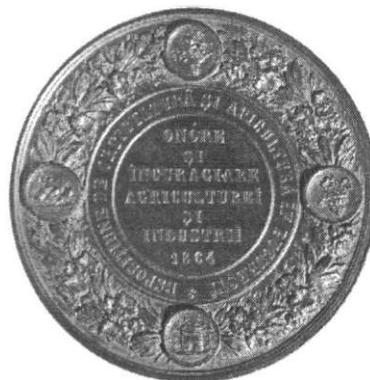
Medalie, Al. I. Cuza – Expoziția de horticultură și apicultură din București , 1864, avers și revers (cat. 26–27).

Médaille, Al. J. Cuza – L'exposition d'horticulture et d'apiculture de Bucarest , 1864, droit et revers (cat. 26–27).