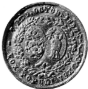
Medalie. Divanurile Ad-hoc întrunite în 7 și 9 octombrie 1857, avers și revers (cat. 1-2) Médaille. Les Divans Ad hoc réunis le 7 et 9 octobre 1857, droit et revers (cat. 1-2).