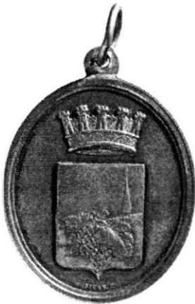
Médaille, La fondation de l'Asile la Princesse Hélène , 1862, droit et revers (cat. 17–19).