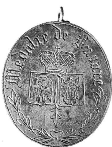
Décoration, l'Ordre de l'Union , 1864, droit et revers (cat. 44).