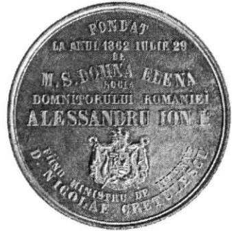
Medalie, Fondarea Azilului Elena Doamna , 1862, avers și revers (cat. 17–19).