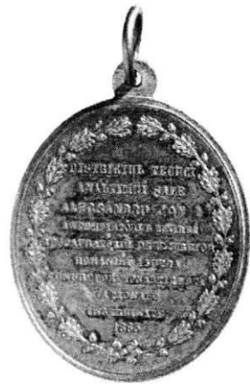
Medalie, Districțul Tecuci lui Al. I. Cuza făuritorul unirii, restauratorul mănăstirilor închinat , 1863, avers și revers (cat. 20–21).