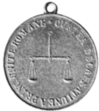
Medalie, Instalarea Curții de Casație a Principatelor Unite la Focșani , 1862, avers și revers (cat. 15–16).