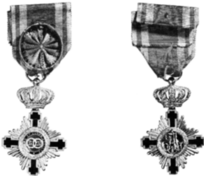
Decorație, Ordinul Unirii , 1864, avers și revers (cat. 44).