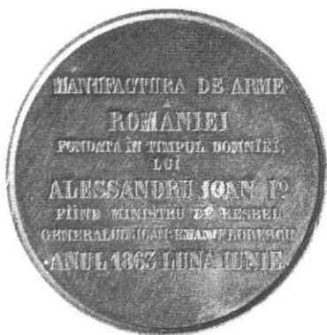
Medalie, Înființarea Manufacturii de arme , 1863, avers și revers (cat. 23–25).

Médaille, La fondation de la Manufacture des armes , 1863, droit et revers (cat. 23–25).