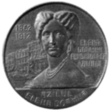
Medalie, Aniversarea a 40 de ani de la fondarea Azilului Elena Doamna, 1912, avers și revers (cat. 84).