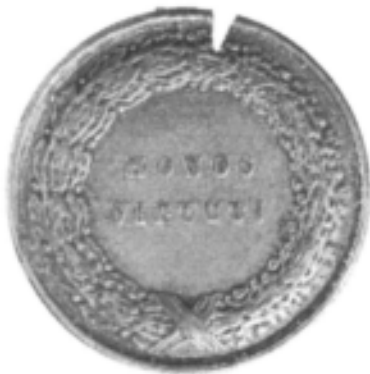
Medalie, 18/30 august 1863 – Honos Virtuti , 1863, avers și revers (cat. 22).

Médaille, 18/30 août 1863 – Honos Virtuti , 1863, droit et revers (cat. 22).