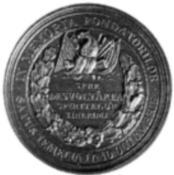
Medalie, Fondarea Academiei Române din București în 1857, rebătură în 1963, avers și revers (cat. 89).