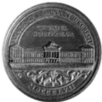
Médaille, Le Centenaire de l'Union des Principautés, 1959, droit et revers (cat. 85).