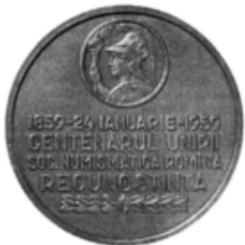
Medalie, Centenarul Unirii Principatelor, 1959, avers și revers (cat. 85).