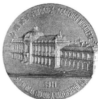
Medalie, 75 ani de la fondarea Academiei Mihăilene din Iași și 50 de ani de la fondarea Universității din Iași, 1911, avers și revers (cat. 68).

Médaille, 75 années de la fondation de l'Académie de Iassy et 50 années de la fondation de l'Université de Iassy, 1911, droit et revers (cat. 68).