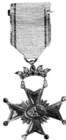
Proiectul Ordinul Unirii , 1864, avers (cat. 43). Projet de l'Ordre de l'Union , 1864, droit (cat. 43).