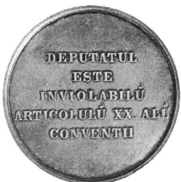
Medalie, 24 ianuarie 1859 – Prima Cameră a Principatelor Unite – Deputatul este inviolabil, 1859, avers și revers (cat. 9). Médaille, 24 janvier 1859 – La première Chambre des Principautés Unies – Le député est inviolable, 1859 droit et revers (cat. 9).