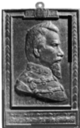
Plachetă unifică, Alexandru I. Cuza – 1859–1866, <1903> (cat. 56; 57).