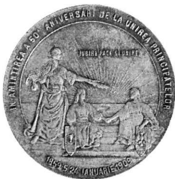
Medalie, Al. I. Cuza – Jubileul Unirii principatelor, 1909, avers și revers (cat. 63).

Médaille, Al. J. Cuza – Le Jubilé de l'Union de Principautés, 1909, droit et revers (cat. 63).