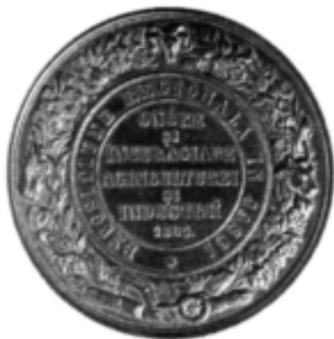
Medalie, Al. I. Cuza – Expoziție regională la Iași, 1865, avers și revers (cat. 33–34).

Médaille, Al. J. Cuza – L'exposition régionale de Iassy, 1865, droit et revers (cat. 33–34).