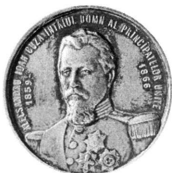
Medalie, 40 de ani de domnie a Regelui Carol I – Al. I. Cuza întâiul domn al Principatelor Unite, 1906, avers și revers (cat. 60).