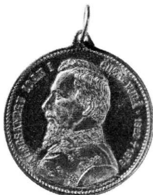
Plaquette uniface, Alexandre J. Cuza – 1859–1866, <1903> (cat. 56; 57).