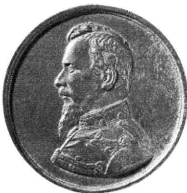
Medalie unifacies, Al. I. Cuza – <probă> (cat. 38).

Médaille, Al. J. Cuza – L'exposition régionale de Fălticeni, 1864, droit et revers (cat. 37).