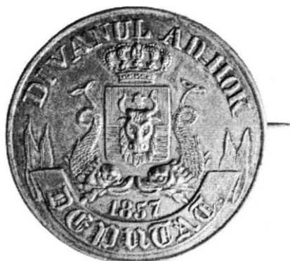
Insignă. Deputat în Divanul Ad-hoc al Moldovei, 1857 (cat. 6-8). Insigne. Député dans Le Divan Ad hoc de la Moldavie, 1857 (cat. 6-8).