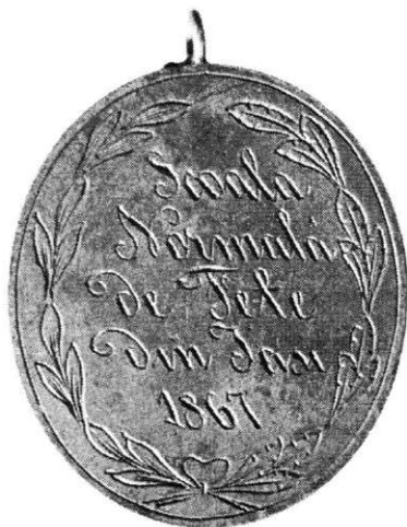
Medalie-premiu, Școala Normală de Fete din Iași , Premiu de onoare – 1867, 1864–1867, avers și revers (cat. 45).