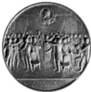
Medalie, Jubileul Unirii Principatelor, 1909, avers și revers (cat. 61–62).

Médaille, Le Jubilé de l'Union des Principautés, 1909, droit et revers (cat. 61–62).