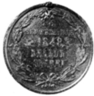
Medalie-decorație, Pro Virtute Militari 13 septembrie 1848, 1864, avers și revers (cat. 39). Médaille-décoration, Pro Vertu militaire 13 septembre 1848, 1864, droit et revers (cat. 39).