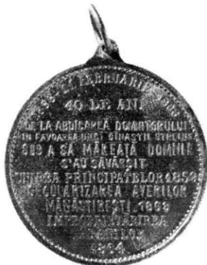
Medalie, 40 de ani de la abdicarea principelui Al. Ioan Cuza, 1906, avers și revers (cat. 58–59).