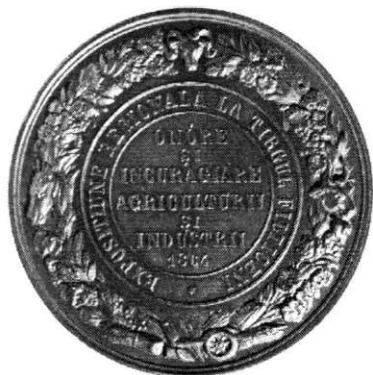
Medalie, Al. I. Cuza – Expoziție regională din Târgul Fălticeni, 1864, avers și revers (cat. 37).

Médaille, Al. J. Cuza – L'exposition régionale de Fălticeni, 1864, droit et revers (cat. 37).