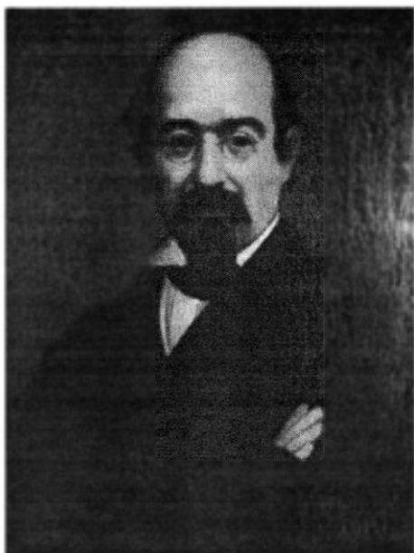
Mihail Kogălniceanu. Reproducere după pictura realizată de Mihail Dan în anul 1864.

Michel Kogălniceanu – reproduction d'après un tableau de Michel Dan de 1864.