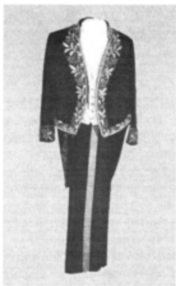
Costumul de diplomat al lui Mihail Kogălniceanu.

«Mot pour l'ouverture du cours d'histoire nationale à l'Académie Michelienne» tenu par Michel Kogălniceanu la 24 novembre 1843. Exemplaire avec la dédicace de l'auteur envers Alexandre Lahovary.