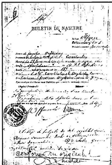
Bulletin de naissance al inginerului Constantin Orghidan. 7 iulie 1874.