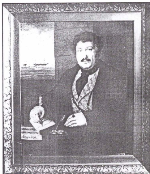
Rudolf Orghidan, portret în ulei de autor necunoscut. Rudolf Orghidan, tableau en huile, anonyme.