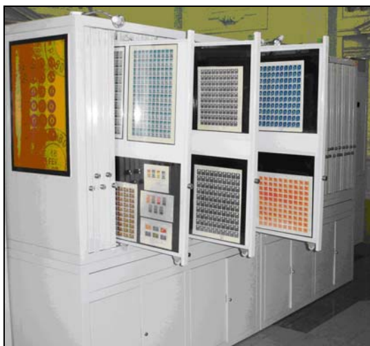
Sala Lahovari Lahovari Hall