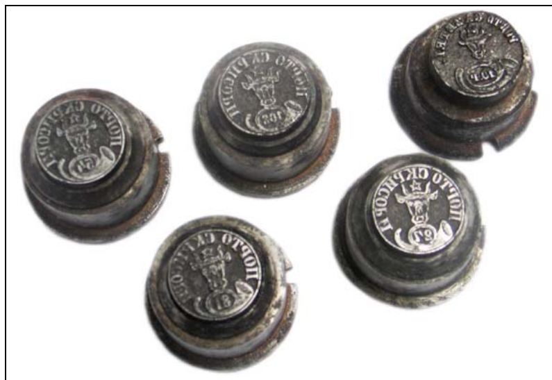
Matrițe Cap bour Stencils, Urus head