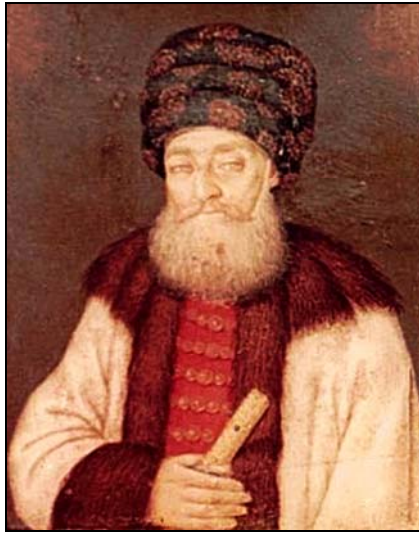
1. Beizadeaua Grigore Mihai Suțu Prince Grigore Mihai Suțu