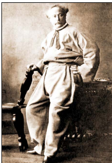
5. Alexandre Dumas fiul Alexandre Dumas son