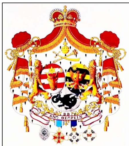
22. Stema familiei Suțu, colecția autorului Suțu family coat of arms. Author's collection