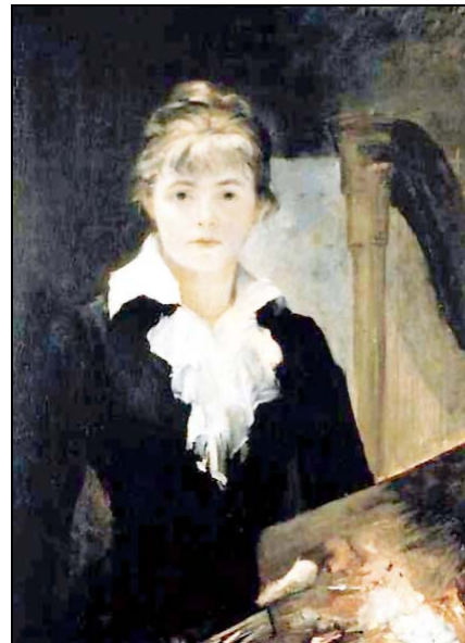
4. Autoportretul Mariei Bashkirtseff, 1880, Musée des Beaux-Arts, Nisa Self-portrait of Maria Bashkirtseff, 1880, Musée des Beaux-Arts, Nisa