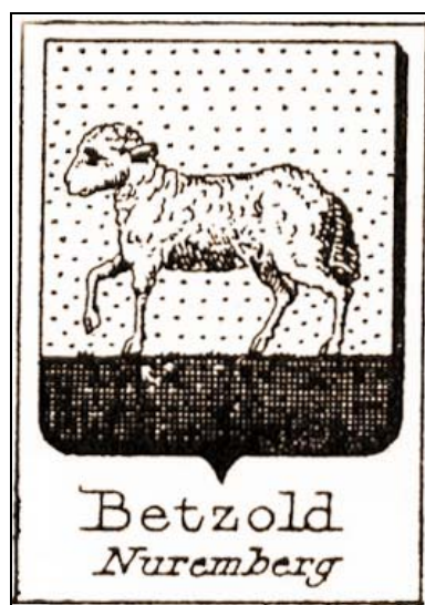
17. Stema familiei Betzold, Armorialul Rietstap, 1887 Family Betzold coat of arms, from Rietstap, 1887