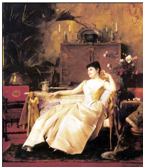
6. Portretul Elisei Suțu pictat de Munkacsy în 1889, colecție particulară în SUA Elisa Suțu portrait painted by Munkacsy in 1889, private collection, U.S.A.