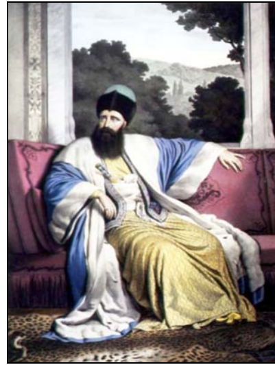
2. Mihail Grigore Suțu vodă, eteristul Prince Mihail Grigore Suțu