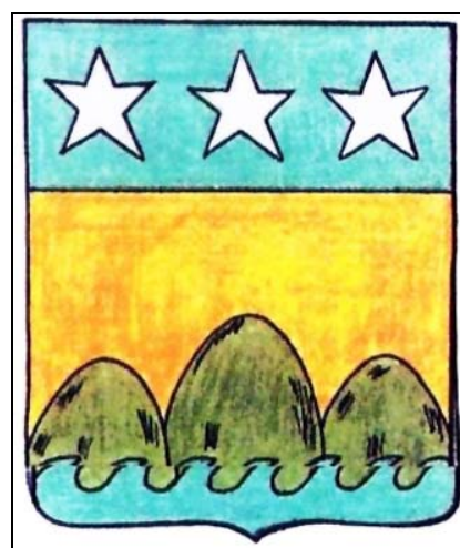
21. Stema familiei Obedeau, Hagi-Moscu, Steme boerești din România, 1923 Obedeau and Hagi-Moscu family coat of arms, România, 1923