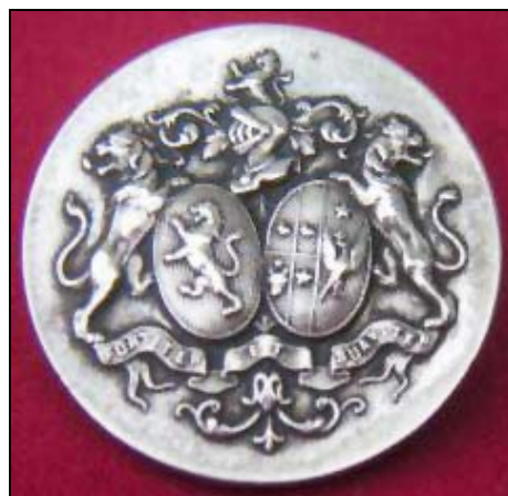
10. Nasture de livrea al casei Werbrouck-Soutzo Button of the family Werbrouck-Soutzo livery