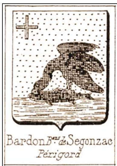
16. Stema familiei de Bardon de Segonzac, Armorialul Rietstap, 1887 Bardon de Segonzac family coat of arms, from Rietstap, 1887