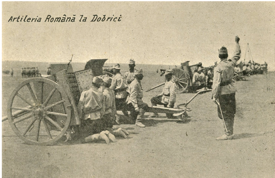
Artileria română la Dobriș. The Romanian Artillery at Dobriș.