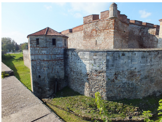
3. Cetatea Vidin (Baba Vida). Vedere dinspre latura de nord, spre Dunăre.

The Vidin Fortress ( Baba Vida ), view from the northern side, towards the Danube.