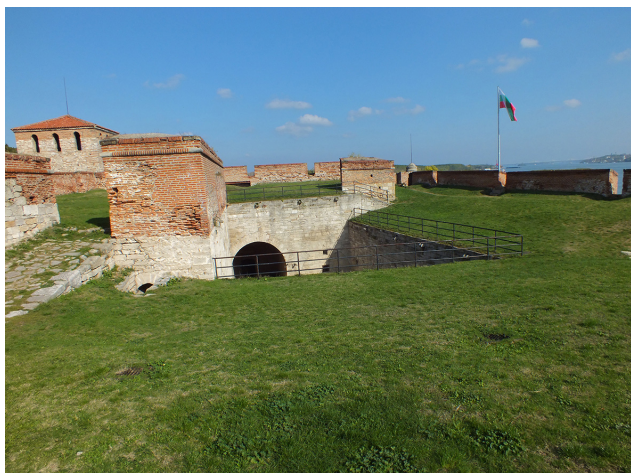
9. Terasa cetății. Latura de nord-est. Foto: Ginel Lazăr.

The terrace of the fortress. The north-eastern side. Photo: Ginel Lazăr