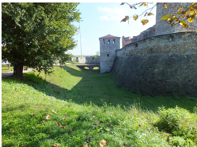
10. Podul de intrare în cetate, cu turnul lui Ioan Strațimir și șanțul de apărare. Vedere dinspre latura de vest.

The terrace of the fortress. The north-eastern side.