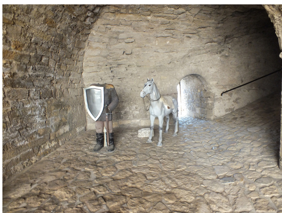
5. Tunelul de acces spre terasa cetății, dinspre curtea interioară.

The Vidin Fortress ( Baba Vida ), view from the north-western side, with the entrance through the bridge over the moat and through the tunnel of the defense tower of Ivan Sratsimir (the 14 th century).