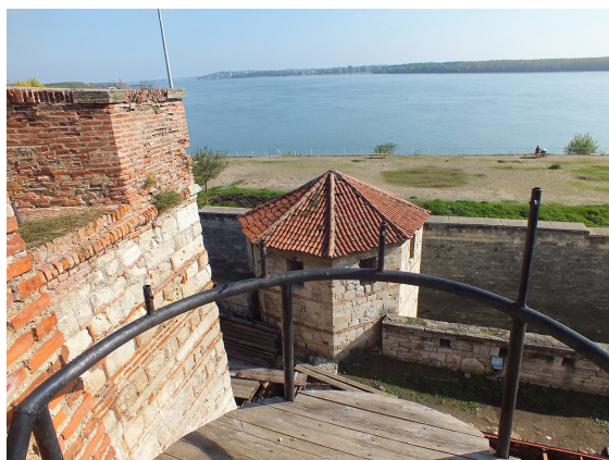
8. Vedere dinspre terasa de nord a cetății. În depărtare se află podul nou peste Dunăre și orașul Calafat.

The access tunnel descending from the terrace to the interior yard of the fortress.