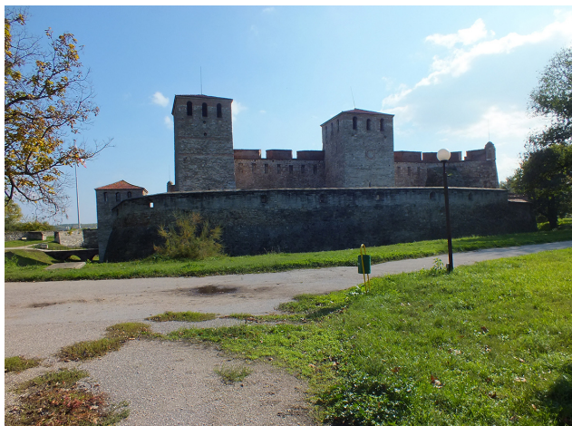
11. Cetatea Vidin (Baba Vida) și puternicele turnuri de apărare de sud. Vedere dinspre latura de sud.

he entrance bridge of the fortress, with Ivan Sratsimir's tower and the moat. View from the western side.