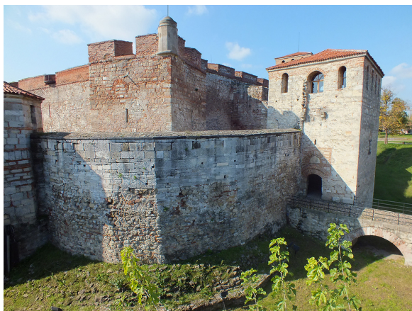
4. Cetatea Vidin (Baba Vida). Vedere dinspre latura de nord- vest, cu intrarea dinspre podul dispus peste șanțul de apărare și prin tunelul turnului de apărare al lui Ivan Strașimir (secolul al XIV- lea)

The Vidin Fortress ( Baba Vida ), view from the northern side, towards the Danube.