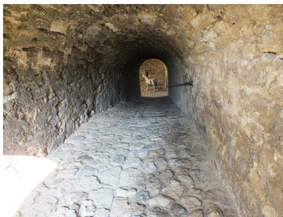
7. Tunelul de acces spre curtea interioară, dinspre terasă. În pantă.

The access tunnel ascending to the terrace of the fortress.